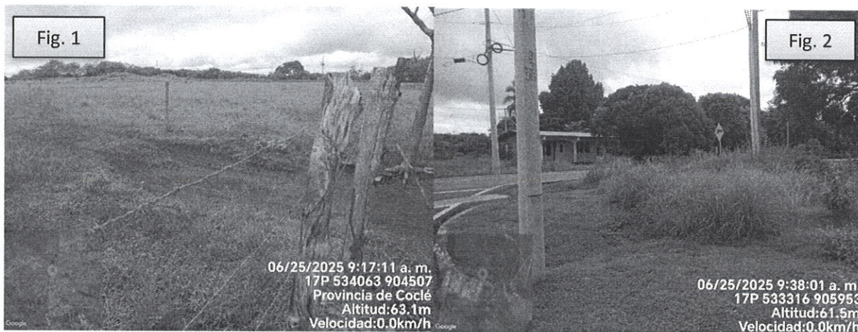
Fig. 1. Ubicación del Poste de inicio de la nueva línea de transmisión a un lado del proyecto Jagüito Green Energy I, indicado durante la inspección. Fig. 2. Poste final antes de entrar a la subestación de Llano Sánchez.