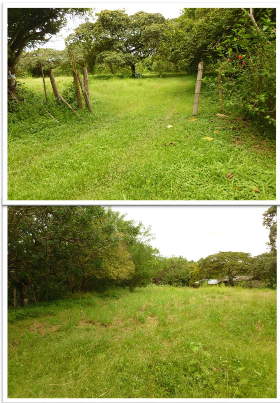
Vista del terreno donde se desarrollará el proyecto