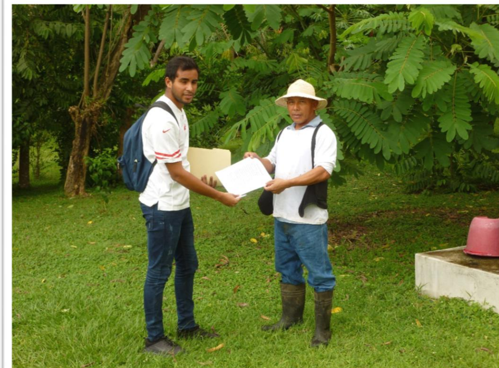
PARTICIPACION CIUDADANA REALIZADA A LA COMUNIDAD