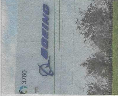
Oficinas de Boeing.

El medio interpreta la tregua como una señal de acercamiento entre China y EE. UU., que esta misma semana sellaron un nuevo pacto de una segunda ronda de negociaciones comerciales, tras la tregua comercial de 90 días que iniciaron mediados de mayo desde los primeros contactos formales en Suiza. La compañía se había quedado fuera del mercado chi-