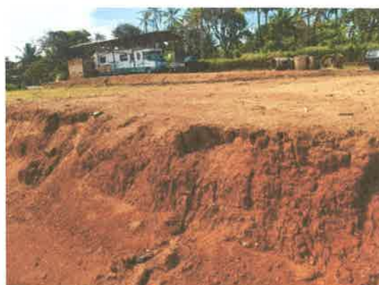
Fotos N° 7 y 8: Vistas generales, tramos prospectados. Terreno plano con zonas alteradas por cortes y desbroce de masa vegetal.

El siguiente cuadro muestra las coordenadas tomadas durante la prospección arqueológica: