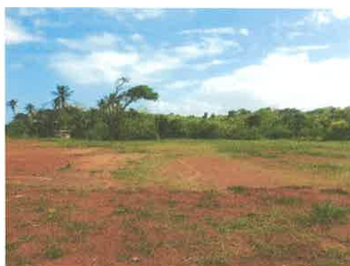
Fotos N° 1, 2, 3, 4, 5 y 6: Vistas generales. Tramos prospectados. Terreno plano tipo potrero con gramíneas y desbroce vegetal, con individuos arbóreos aledaños al área.