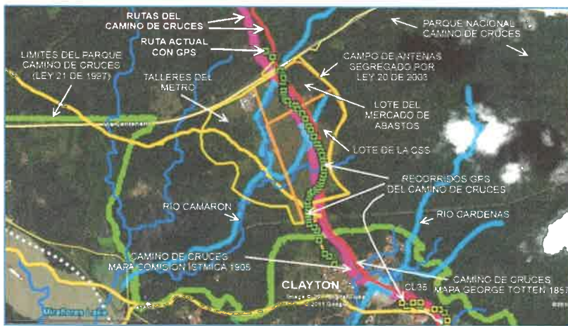
Representación gráfica satelital de la Ruta Camino de Cruces (Tomada del libro: El Camino De Cruces “La Primera Ruta Multimodal de Las Américas” )

En el libro “La Ruta de Cruces” (La primera Ruta Multimodal De Las Américas), se dan los siguientes señalamientos del Profesor Barrera (historiador): “Hoy día poco más de dos tercios del Camino de Cruces está en parte protegido por el Parque Nacional Soberanía y el Parque Nacional Camino de Cruces. El otro tercio ha quedado desprotegido. Una parte fue afectada con las construcciones de emplazamientos de defensa y viviendas por los norteamericanos en Clayton, Llanos de Curundú y Altos de Curundú, y por vías primero de piedra y luego de asfalto – como la carretera 12 que va de Clayton a Curundú que hoy forma las avenidas Demetrio Lakas y Ascanio Villalaz-. Otra parte con empedrados está dentro del área conocida como el campo de antenas de Chivo-Chivo en donde los norteamericanos primero establecieron un campo de tiro y luego estaciones de radio-escucha y telecomunicaciones como parte de su estrategia de la Guerra Fría”.