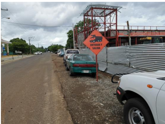
Foto 7) Entrada del proyecto y acceso de Equipos y Camiones al proyecto