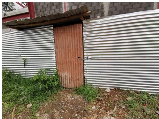
Foto 12) Se mantiene el recinto para la disposición temporal de los desechos. Se abrió una puerta externa para el retiro mediante camiones.