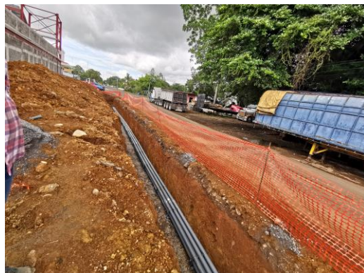
Foto 10) Trabajos de excavación colindantes con la calle posterior al proyecto