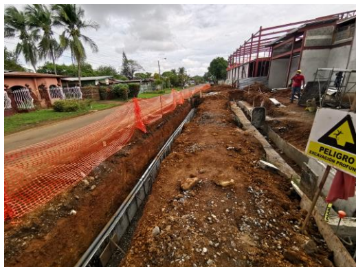
Foto 9) Trabajos de excavación colindantes con la calle posterior al proyecto