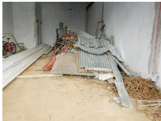
Foto 14) De las áreas construidas, que tienen piso y techo, se habilitó uno de los locales para colocar desechos de construcción.