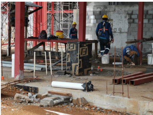
Foto 11) Los cestos para la recolección de los desechos comunes se colocan con bolsas negras en áreas techadas.