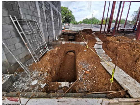
Foto 16) Material excavado ubicado bajo techo por lo que no se erosiona