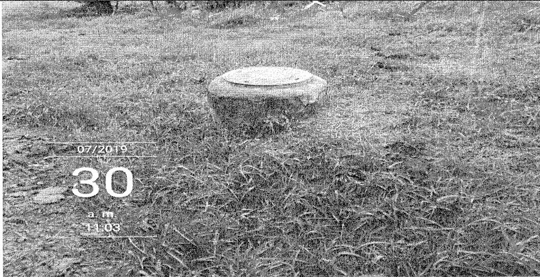
Foto 3. Topografía del terreno