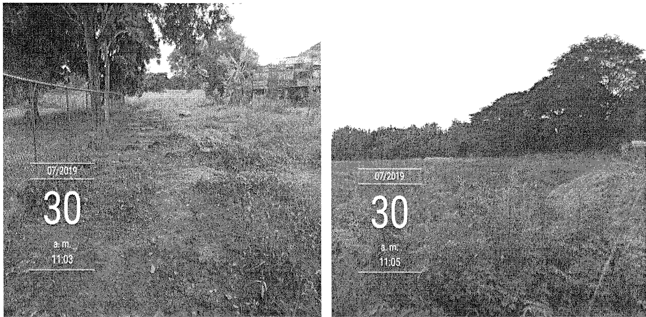
Foto 1 y 2: entrada del proyecto y vegetación del área de influencia directa.