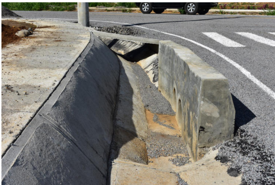
Foto 6 Reforzamiento de taludes para prevenir la erosión Proyecto Residencial Hacienda María