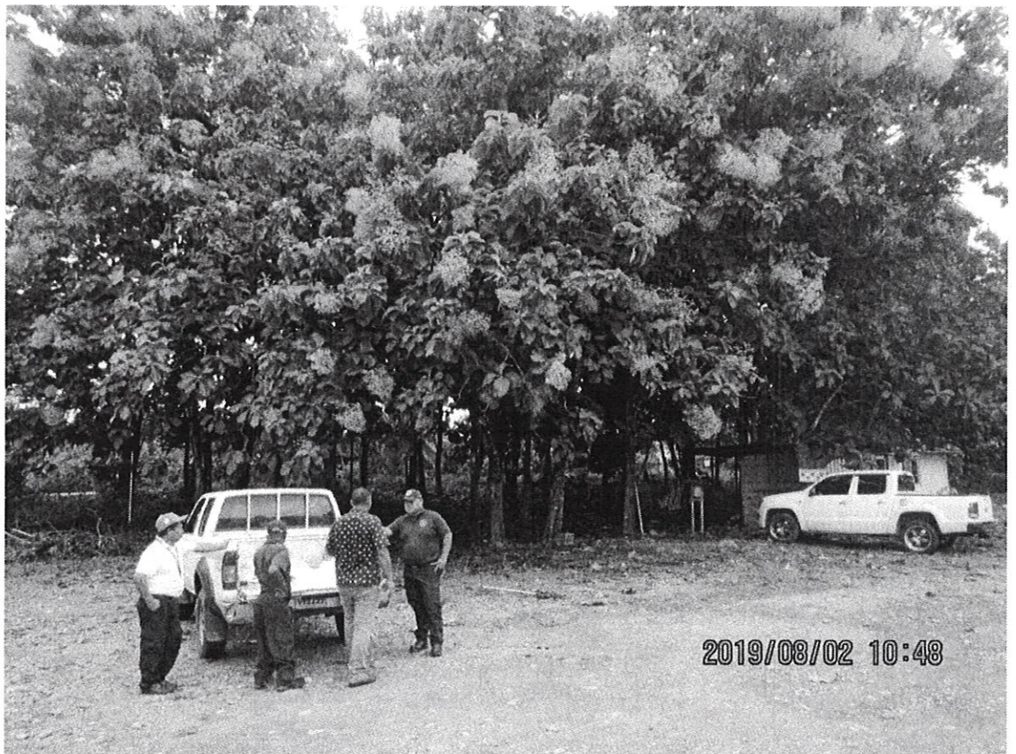
Fig. No.3: Vista del rodal de Teca (Tectona grandis) y los participantes de la inspección