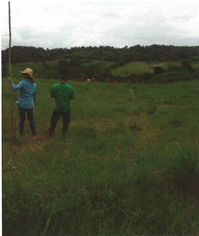
Vista de la vegetación existente