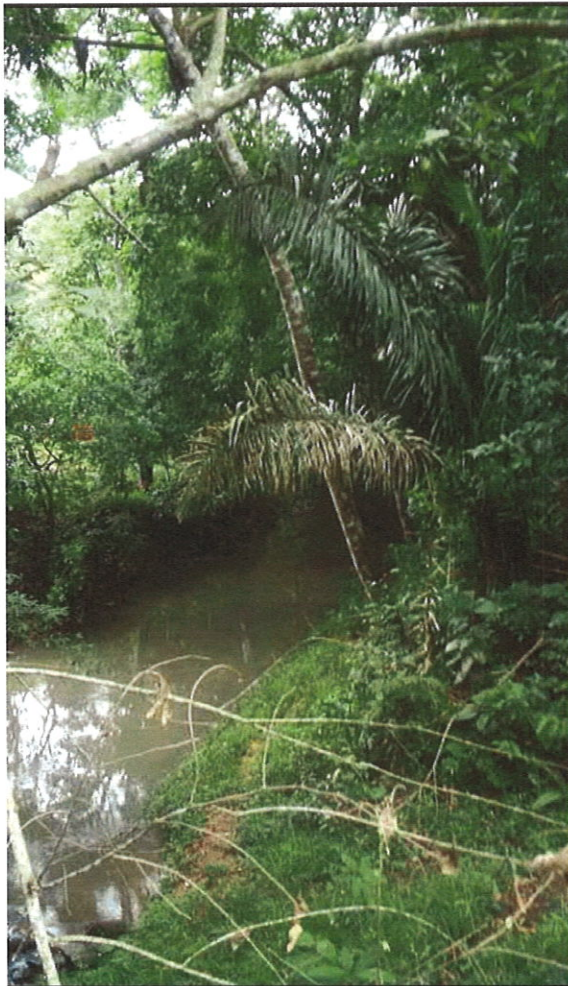
Vista del cuerpo de agua que colinda con el proyecto.