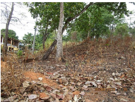
Fotos No. 15, 16, 17 Prospección en tramos alterados del polígono.

Dadas las condiciones pedregosas y de rellenos basura del sub-suelo, hubo pocos sondeos.