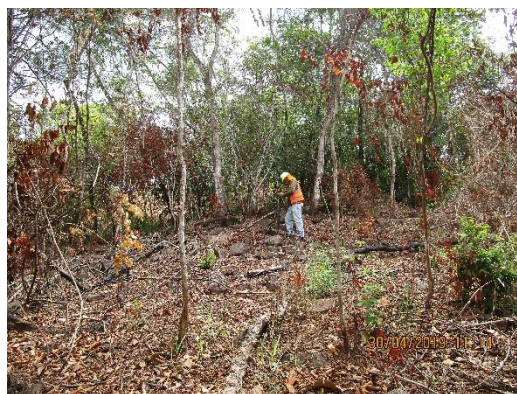
Fotos No. 1 y 2 Prospección en tramos Alterados del polígono