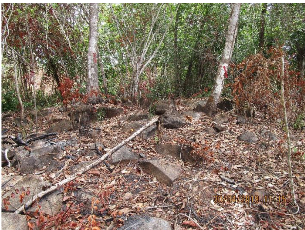
Fotos No. 3, 4, 5, 6, 7 Prospección en tramos Alterados del polígono.