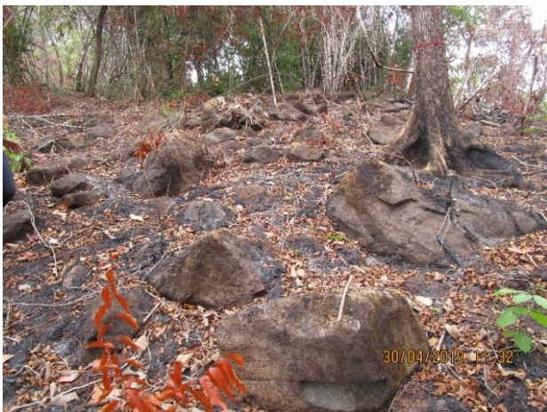
Fotos No. 12, 13, 14 Prospección en tramos alterados del polígono Observe herbazales quemados, y tramos con afloramientos pedregosos.