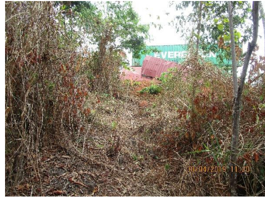
Fotos No. 8, 9, 10, 11 Prospección en tramos

Alterados del polígono. Observe herbazales quemados, y tramos con afloramientos pedregosos.