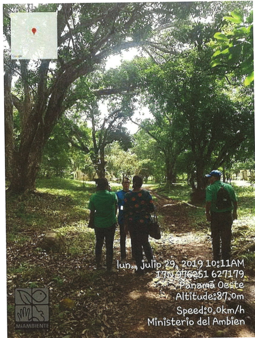
Personal durante el recorrido dentro del polígono.