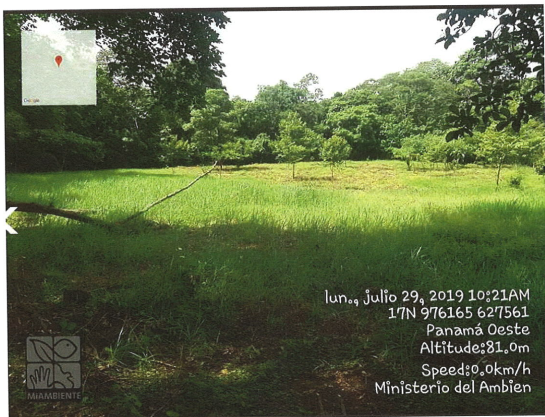
Vista de la vegetación existente