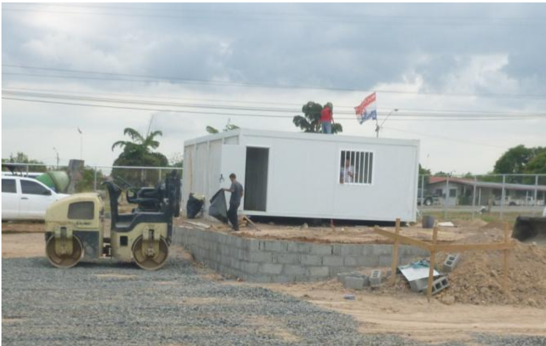
Vista de las unidades prefabricadas.