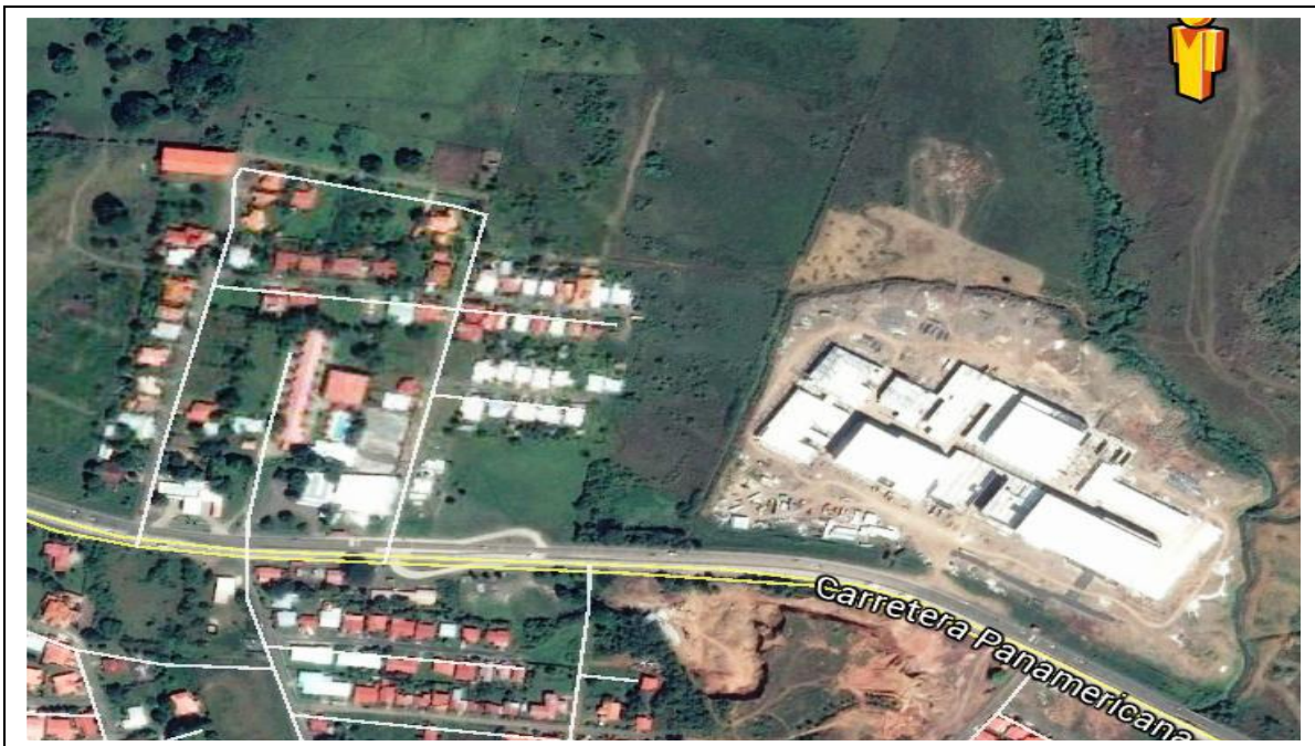
Figura 1. Localización Regional del Proyecto Los Islotes.