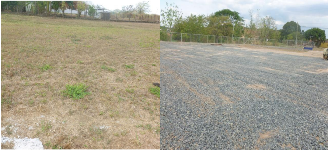
Vista del patio del local, antes y después