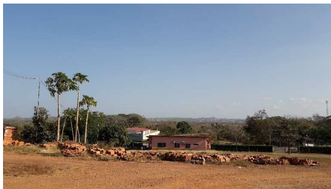
Proyecto: Coordenadas 7.955095,-80.487057 Lat/Long WGS84 Ubicación: Corregimiento La Arena, Distrito Chitré (Km 2.2, Vía Pesé)

CORREGIMIENTO DE LA ARENA DISTRITO DE CHITRÉ, PROV. DE HERRERA https://goo.gl/maps/UP2ZahXfnoT2