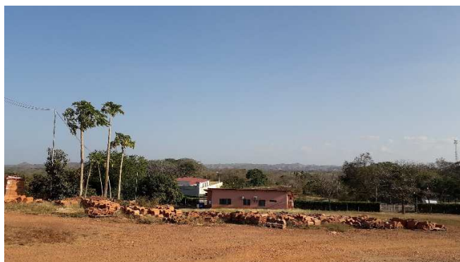
Proyecto: Coordenadas 7.955095,-80.487057 Lat/Long WGS84 Ubicación: Corregimiento La Arena, Distrito Chitré (Km 2.2, Vía Pesé)

CORREGIMIENTO DE LA ARENA DISTRITO DE CHITRÉ, PROV. DE HERRERA