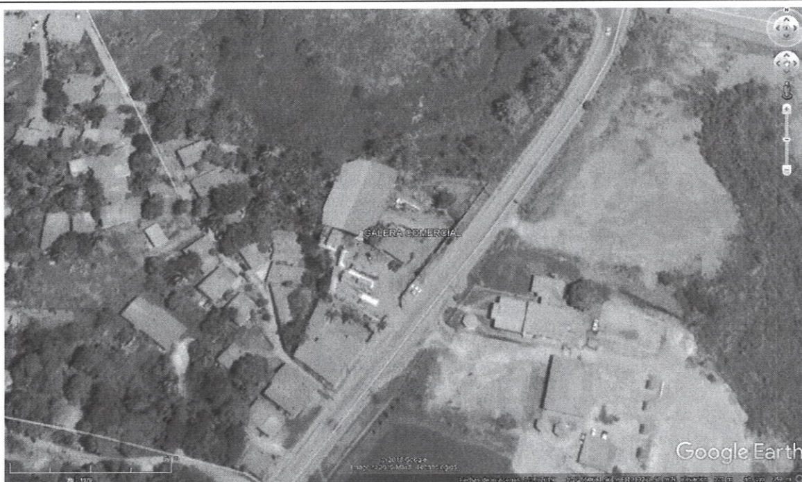
La figura 1. Muestra la imagen satelital del proyecto denominado “GALERA COMERCIAL” Google Earth Pro