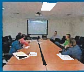
Reunión de inicio de auditoría