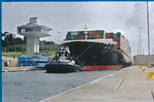
Esclusas Agua Clara