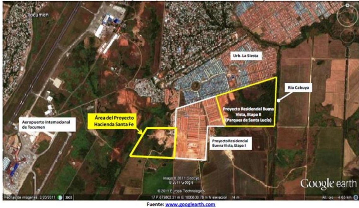
Ilustración 1 Ubicación geográfica del proyecto Urbanización Hacienda Santa Fe (Imagen satelital)