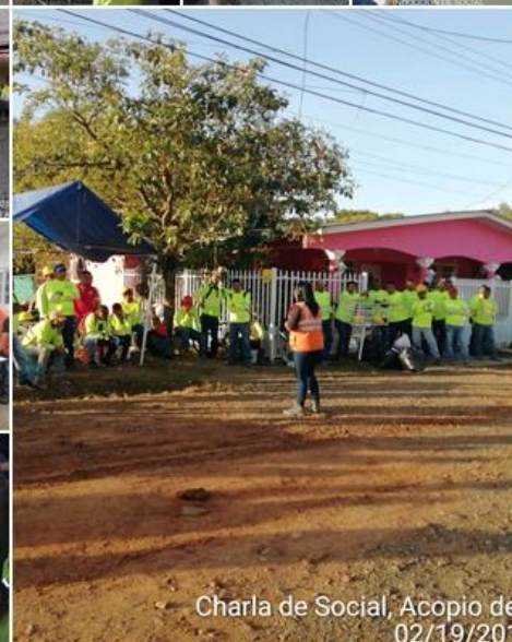
Charla de Social, Acopio de 02/19/201