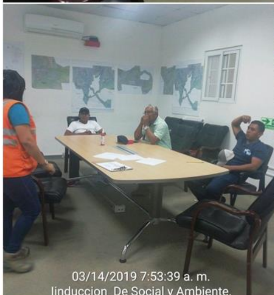
03/14/2019 7:53:39 a. m. Inducción De Social y Ambiente.