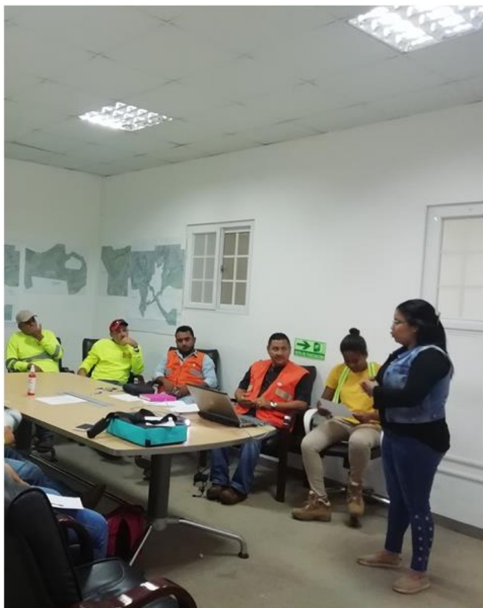
Foto 1. CHARLAS E INDUCCIONES IMPARTIDAS POR PARTE DEL DEPARTAMENTO DE SEGURIDAD, AMBIENTE Y SOCIAL.