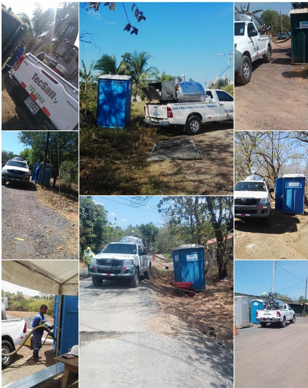
Foto 2. MANEJO DE DESECHOS LÍQUIDOS