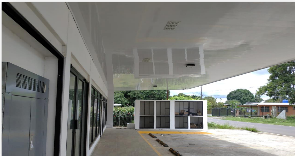
Foto 4. Área de disposición de desechos domésticos para cada local. Agosto 2019. G. Santamaría.