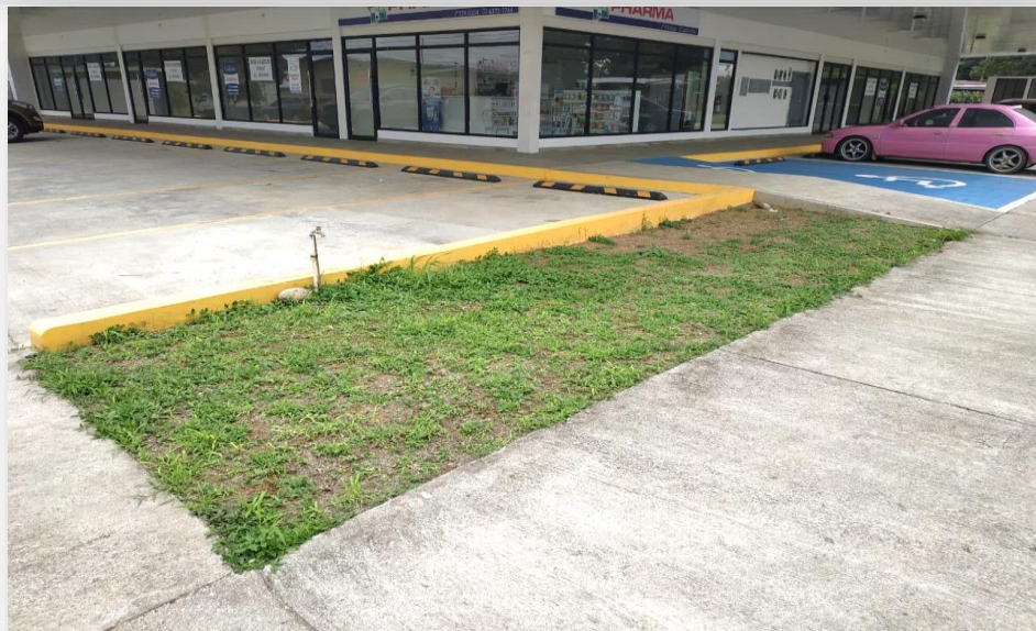
Fotos 5 y 6. Parte de los estacionamientos del proyecto Plaza Comercial Doleguita y área verde donde se estableció un pequeño jardín. Agosto 2019.