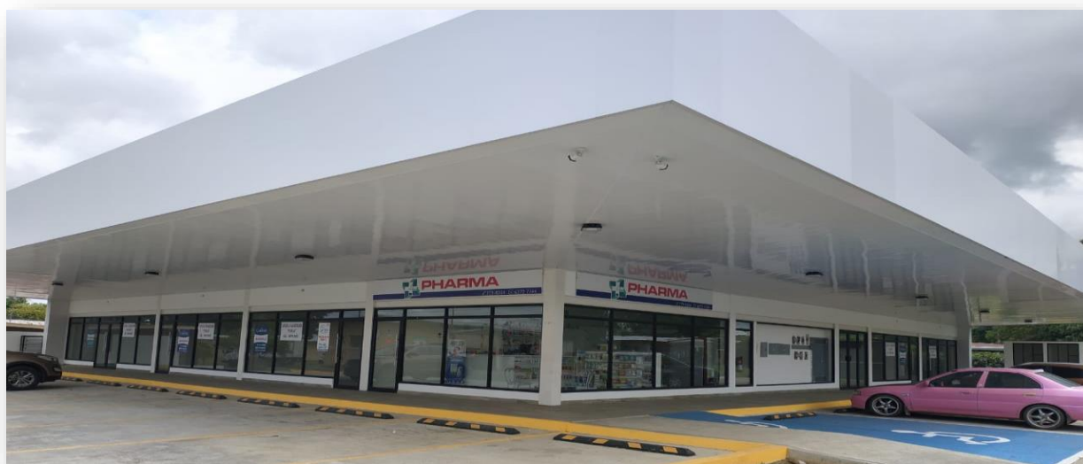
Foto 3. Plaza comercial Doleguita terminada. Se observan los estacionamientos con sus respectivas señalizaciones. Agosto 2019.