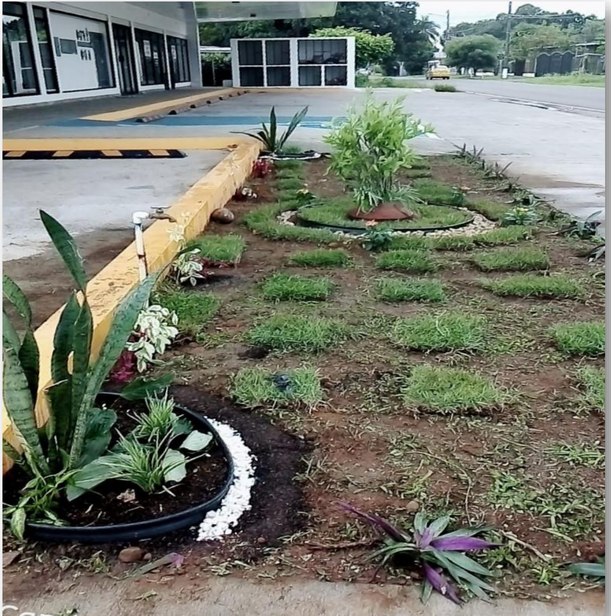
Foto 7. Jardín establecido en el área verde de plaza Comercial Doleguita. 23 de agosto 2019. G. Santamaría.