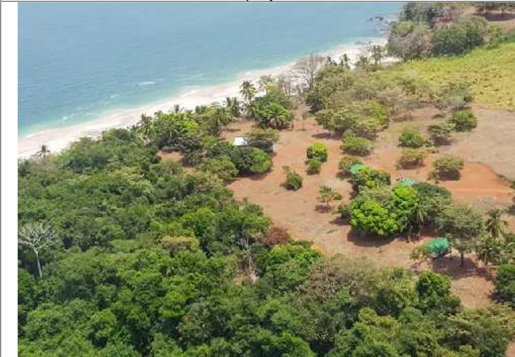
Foto 2. Vista del área de construcción de los tanques de combustible, en el área del Proyecto.