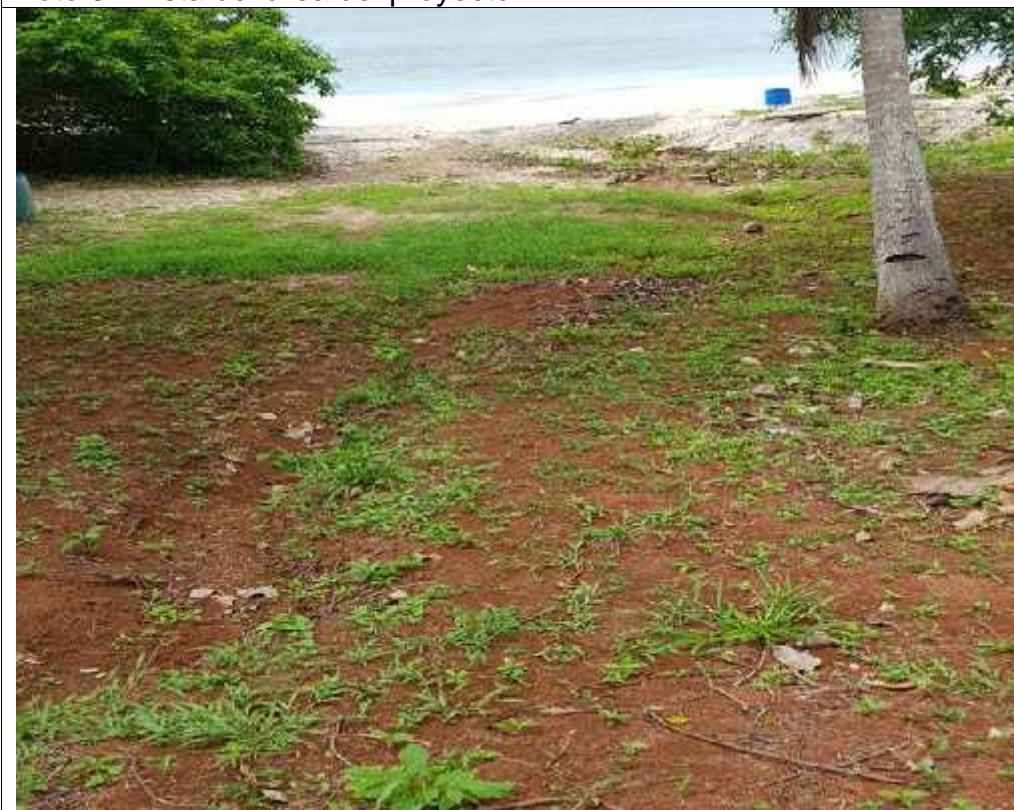
Foto 4. Frente de playa.