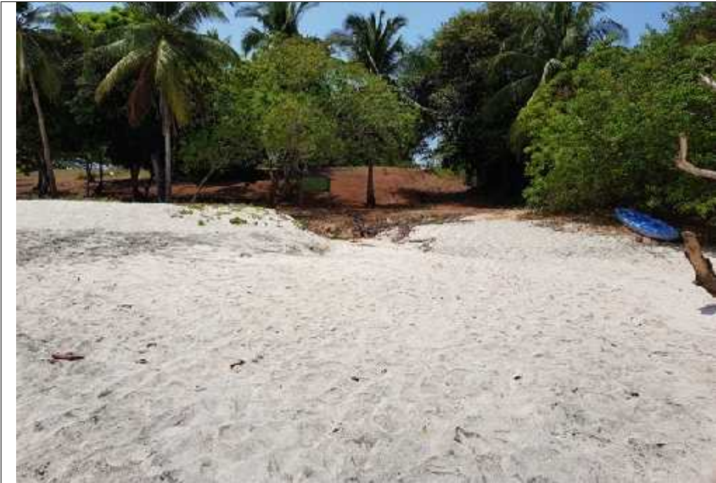
Foto 1. Vista frontal del área del proyecto.