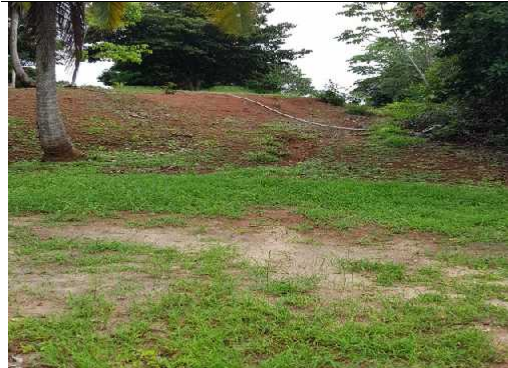
Foto 3. Vista del área del proyecto