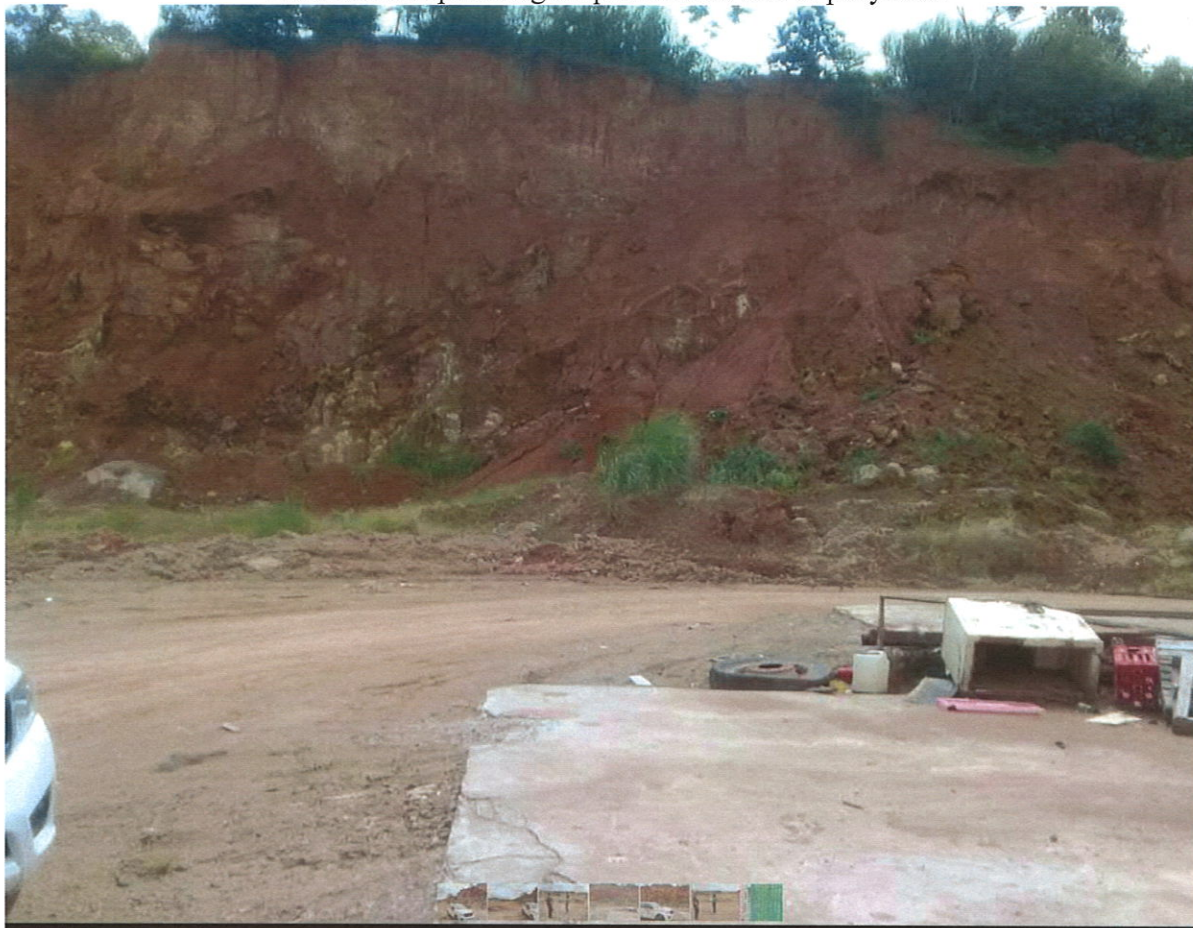
Vista de la vegetación existente