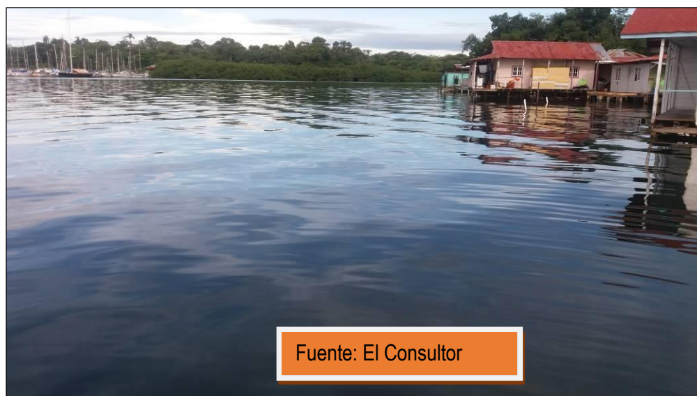
Foto No.6 Se observa la concesión o permiso otorgado por la ANATI.