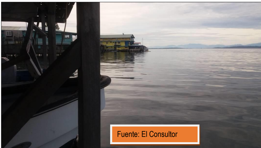
Foto No.4 Área de muelle o estacionamiento de los botes de la propietaria del proyecto.