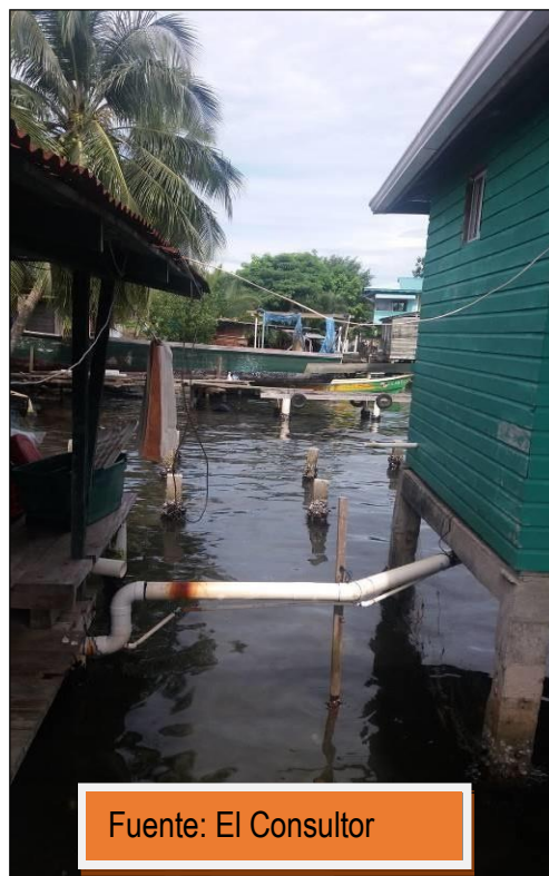
Foto No.3 Conexión de la residencia o finca de la Sra. Angarita y conexiones existentes.