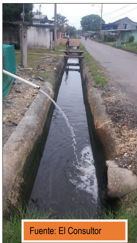
Foto No. 8 Aguas residuales de la isla que producen malos olores.