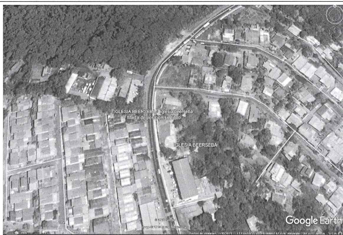
La figura 1. Muestra la imagen satelital del proyecto denominado “ NUEVO TEMPLO DE LA IGLESIA BEERSEBA ” Google Earth Pro