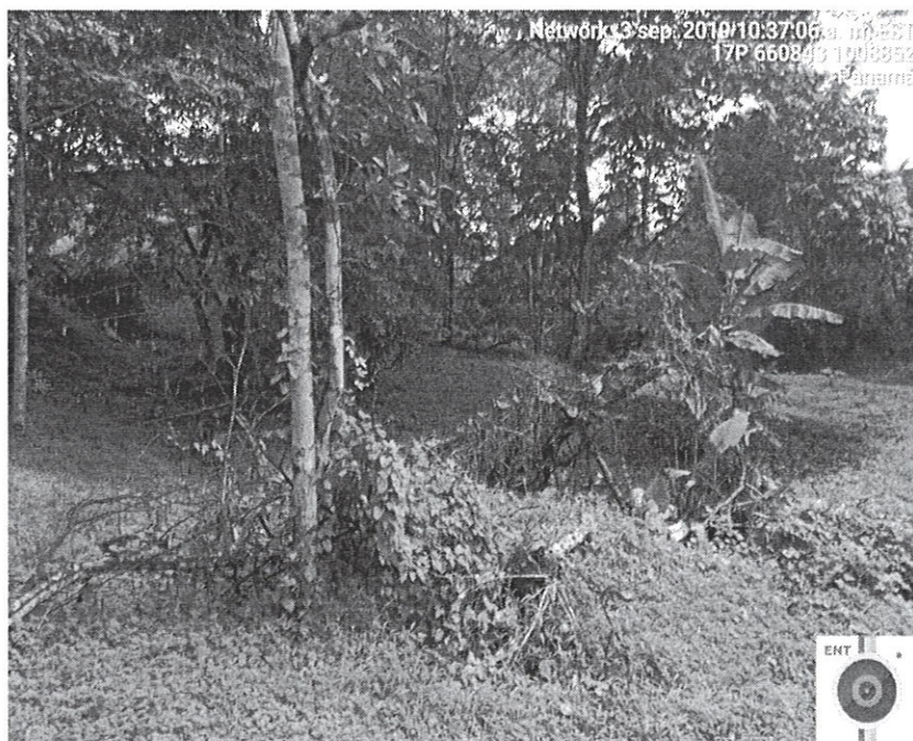
Fig. No. 2

La Figura muestra la parte trasera del globo de terreno donde apreciamos un grupo de árboles, gramíneas.