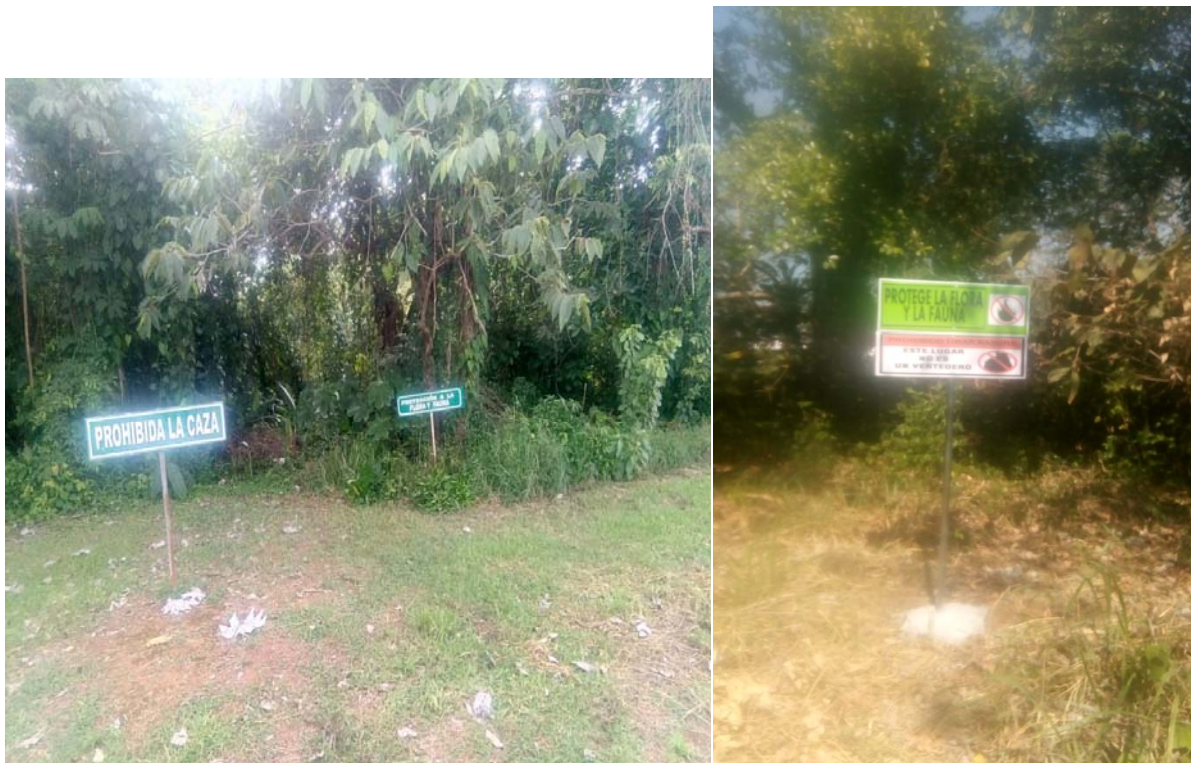
Fig.6.: Se aprecian los letreros colocados en el proyecto relacionados con la protección de la flora y fauna de lugar