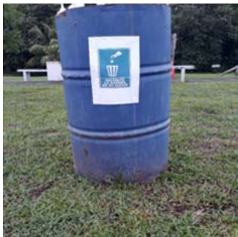
Fig. 2: Tanques para la colección de desechos del Proyecto Quintas de la Riviera utilizados por el promotor para el proyecto Área Social de Quintas de la Riviera.

Evidencia de las acciones implementadas en el cumplimiento del PMA y la resolución de aprobación del EsIA