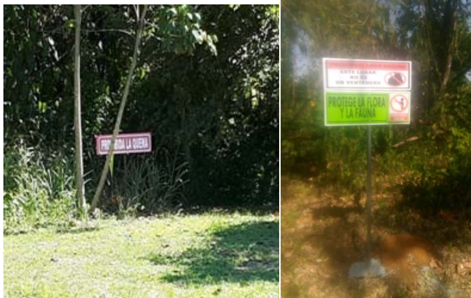
Fig.3.: Carteles de prohibida la quema, de no tirar basura y de protección a la flora y fauna, a la vista de quienes trabajan en el sitio.