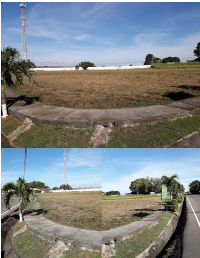
Fig.1, 2 y 3: En la imagen se aprecia la limpieza de la corteza vegetal. Aceras, revegetación y calles en concreto asfáltico

Evidencia de las acciones ejecutadas en el proyecto “Área Social de Quintas de la Riviera”.