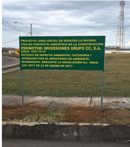
Fig.5.: Se aprecia letrero instalado según instruido por MiAmbiente.