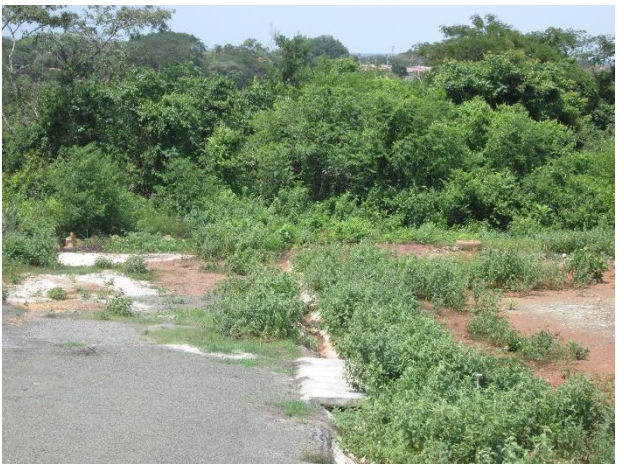
Vistas del proyecto.