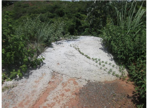
Restos de concreto sobrante vaciado en el terreno.