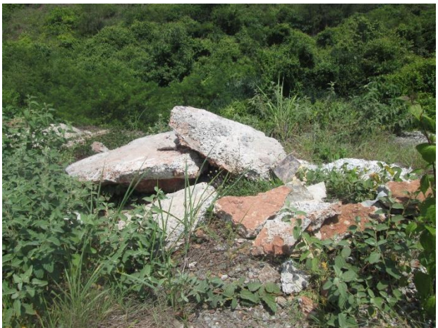
Restos de materiales de construcción y caliche depositados en el borde da la zanja pluvial.