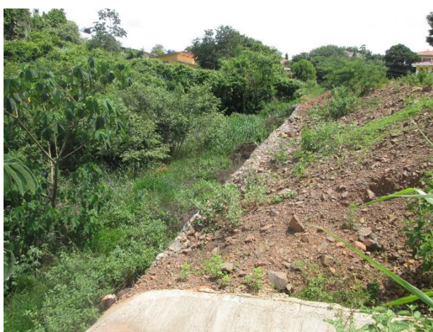
Taludes erosionados, sin protección vegetal.