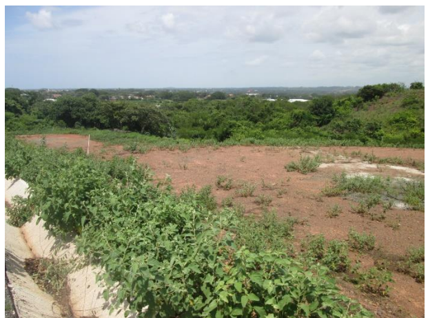
Restos de agua de lavado de concretera vertida en la cuneta y en el terreno.