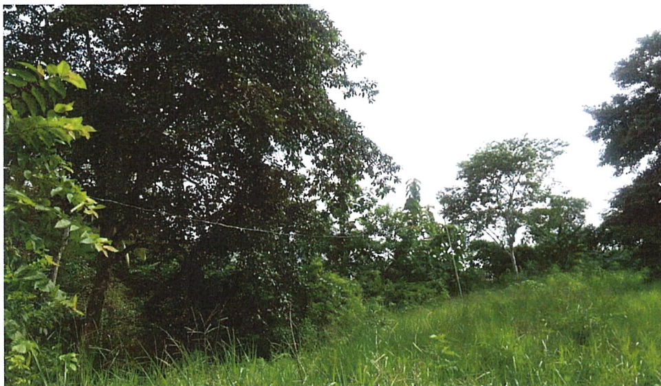
Vista de la vegetación existente en el terreno