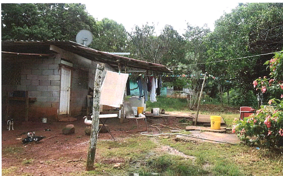
Vistas de las estructuras dentro del terreno que seran demolidas