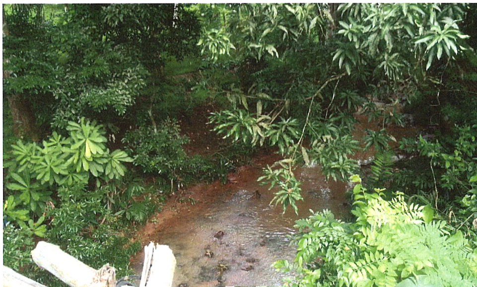
Vista de del cuerpo de agua colindante al proyecto