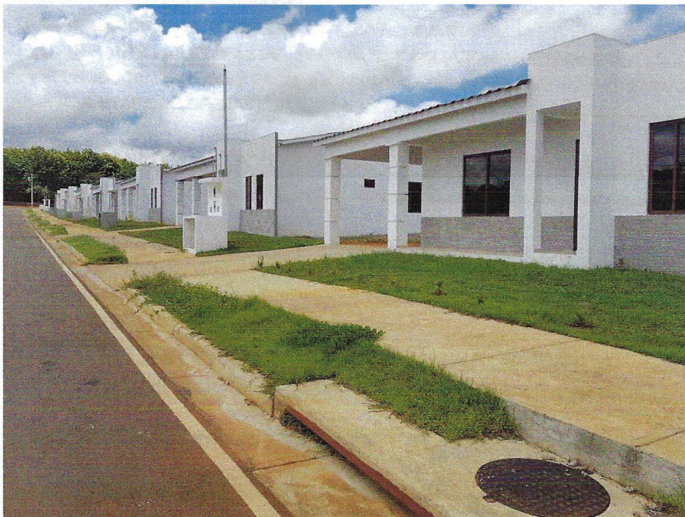
Comunidad de Montilla, Corregimiento de San Pablo Viejo, Distrito de David, Provincia de Chiriquí.

RESOLUCIÓN DRCH-IA-091-2016 de 26 de Julio de 2016