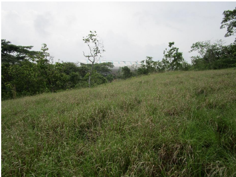
Fotos No. 7, 8, 9, 10, 11 Tramos prospectados y hallazgos culturales identificados