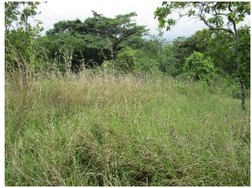
Fotos No.16, 17, 18, 19, 20 Exploración de tramos y sondeos en polígono del proyecto