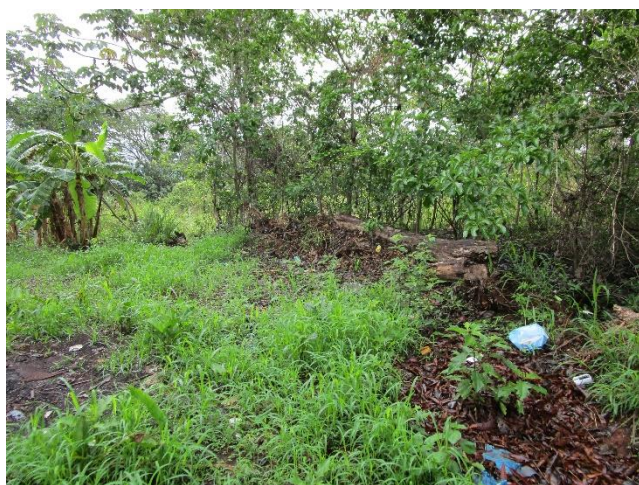
Foto No.1 Se observa huellas de alteraciones antropogénicas (cultivos domésticos)

El polígono del proyecto ocupa una superficie de 15 hectáreas, es un terreno plano tipo potrero, con algunas elevaciones (cerros); esta contextualizado en una zona urbana (Área de Influencia Indirecta). Posee vegetación en gran parte de tramos (Tipo herbazales, gramíneas, y especies domesticas). El suelo es arcilloso con coloración chocolate oscura 5YR 4/ 6 -5YR 4 / 4, y semi-oscura 10R 3/ 4-10 R 3 / 6 (Tabla Munsell Chart Soil Color 1994). Los hallazgos ocurrieron en los puntos identificados del polígono ( Ver ANEXO ) descritos en la Tabla de Coordenadas Satelitales. Los fragmentos observados en superficie corresponden a data cerámica prehispánica. Se definió un perímetro en el área de hallazgos culturales para sobre este realizar las respectivas medidas de mitigación para el Plan de Manejo Ambiental del proyecto en estudio.