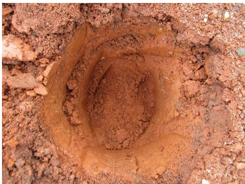
Fotos No.21, 22, 23, 24, 25, 26, 27 Sondeos en polígono del proyecto