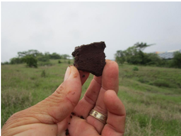
Fotos No. 12, 13, 14, 15 Hallazgos culturales identificados en superficie; pruebas de sondeos