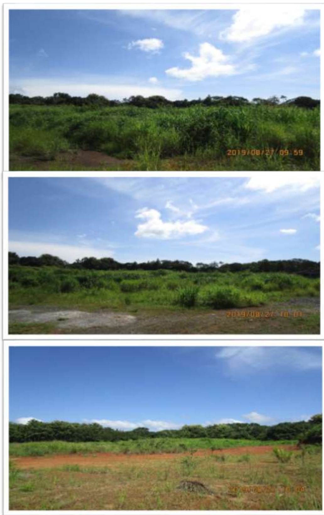
Vista del terreno donde se desarrollará el proyecto EsIA CATEGORIA I / URBANIZACION PASEO DEL SOL 2