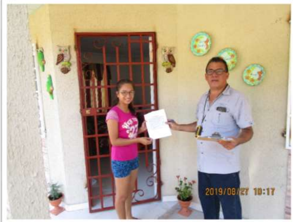
Participación ciudadana realizada a la comunidad más cercana

EsIA CATEGORIA I / URBANIZACION PASEO DEL SOL 2