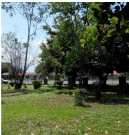
Vista del sitio previo a la intervención con el proyecto