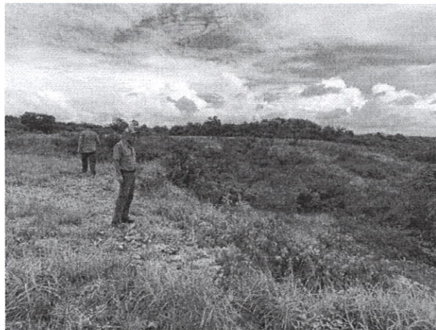
Fig. 4: Limite del proyecto con la quebrada Lajas.