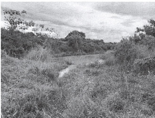
Fig. 1: Quebrada o drenaje natural dentro del área del polígono a desarrollar.