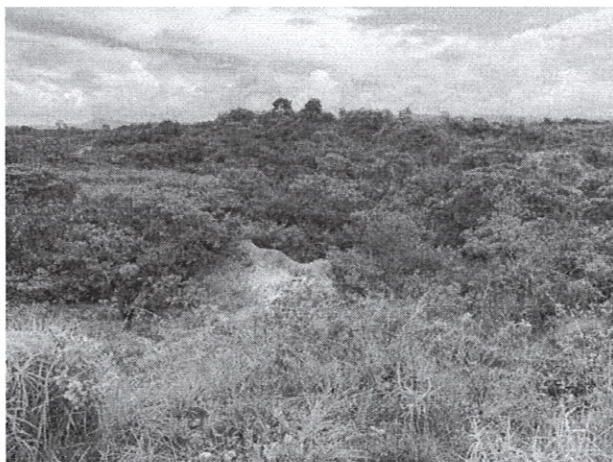
Fig. 3: Vegetación del bosque de galería de la quebrada Lajas