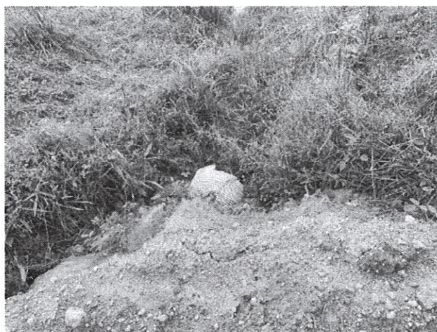
Fig.2: Tubería debajo del camino que drenan las aguas de la quebrada o drenaje natural hacia otra finca.