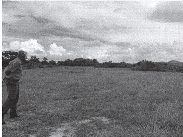
Fig. 5: Área donde se realizara el proyecto