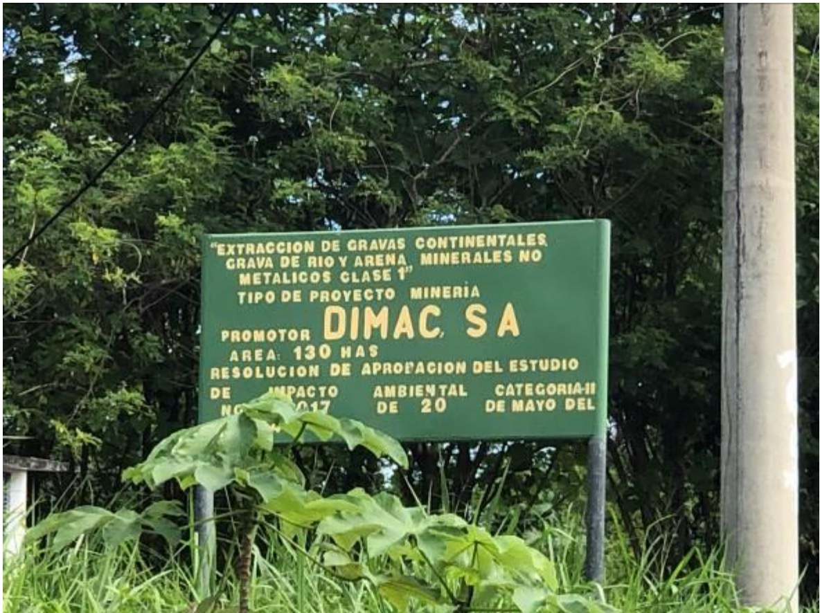
Foto 2. La empresa ha realizado actividades de reforestación en la zona con árboles maderables como medida compensatoria y mitigación.