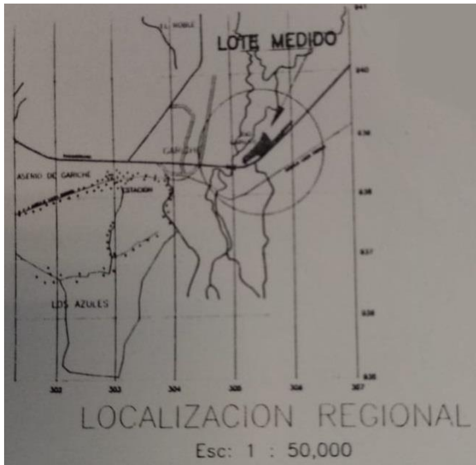
Imagen 1: Localización del proyecto.