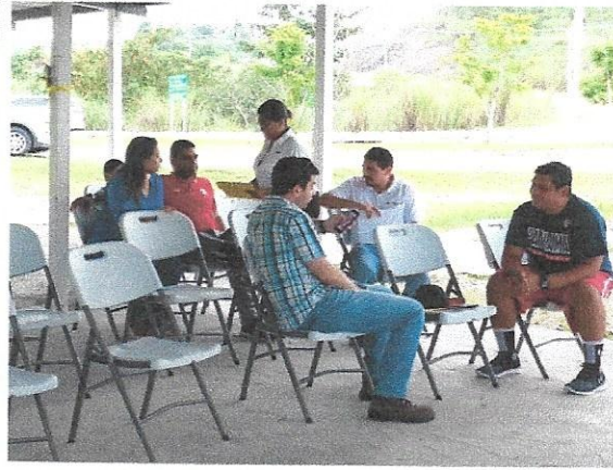
Figura 4.Reunión informativa.