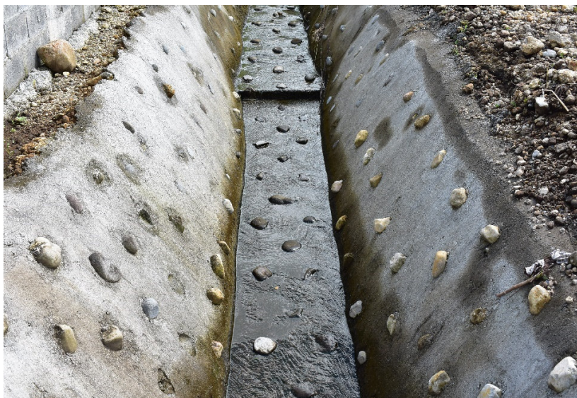
Foto 7 Acondicionamiento de la red de drenajes Proyecto Urbanización Los Altos de Gariché - Etapa III