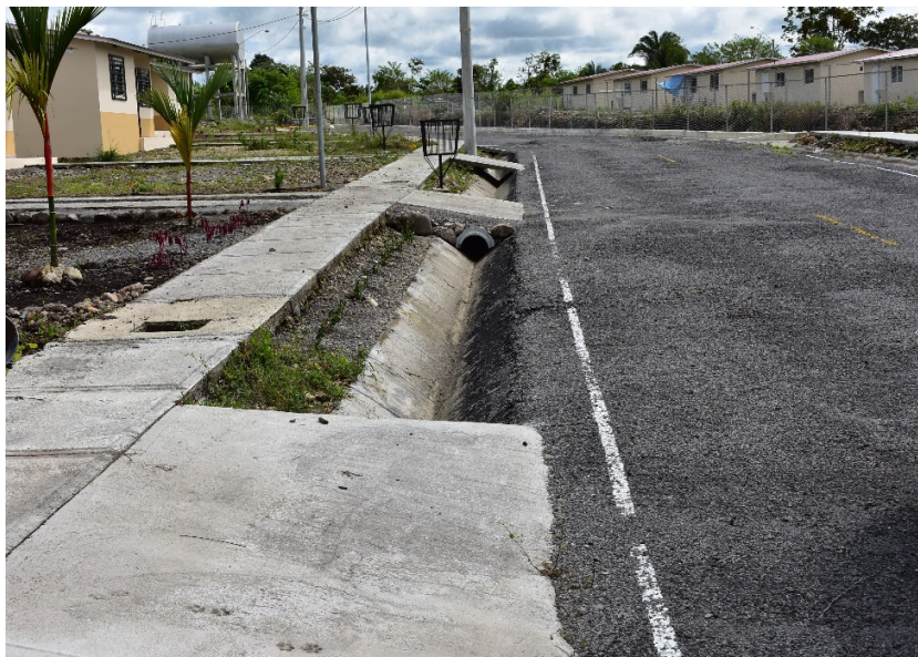
Foto 9 Acondicionamiento de la red de drenajes Proyecto Urbanización Los Altos de Gariché - Etapa III