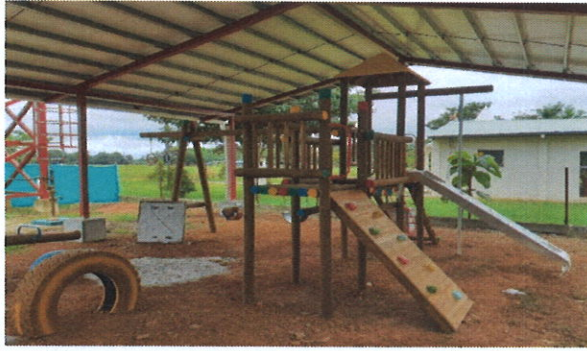
Vista del área infantil