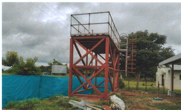
Vista de la estructura del tanque de agua