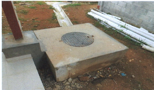
Vista de las obras sanitarias