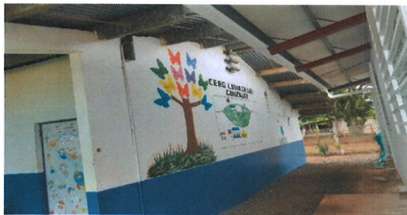
Vista parcial del edificio antiguo de la escuela