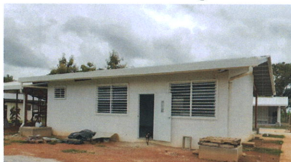
Avance de la obra 60%