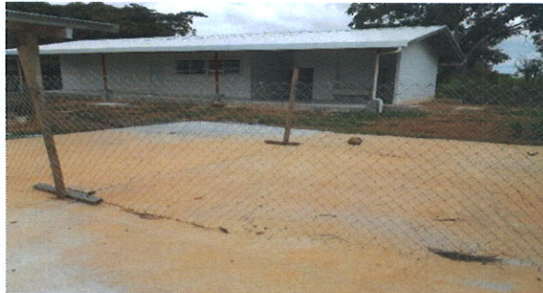
Vista parcial del avance de la obra