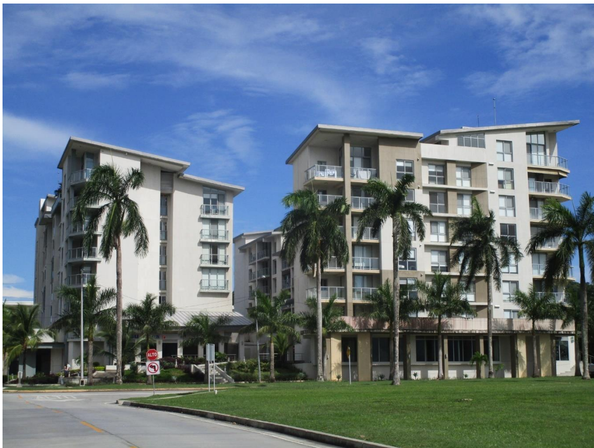
Vista frontal del edificio Mosaic