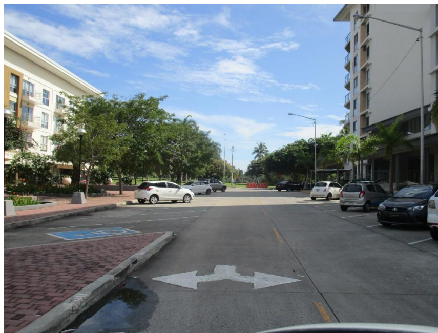
Fotografía 1. Calles internas pavimentadas