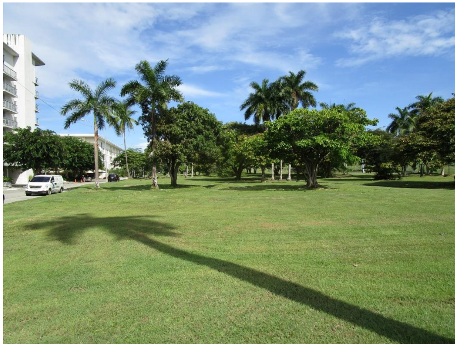
Fotografía 5. Áreas cubiertas con grama en lote colindante con edificio Mosaic