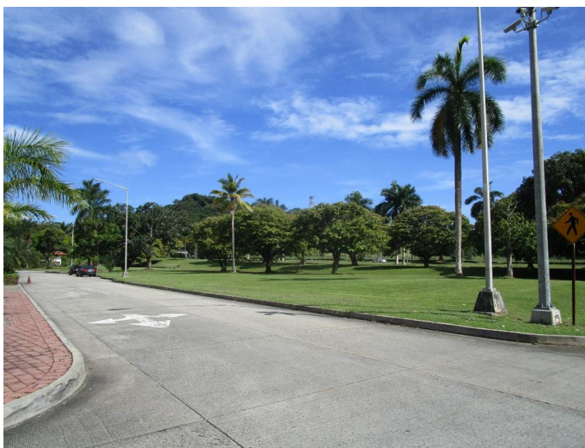
Fotografía 2. Calle lateral a edificio Mosaic.