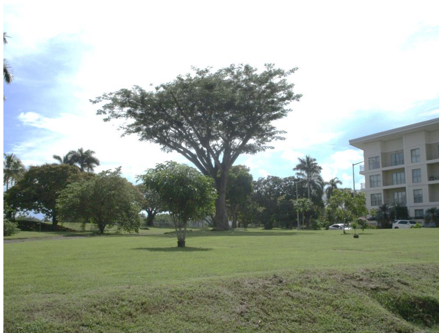
Fotografía 6. Áreas con grama en parte posterior a edificio Soleo