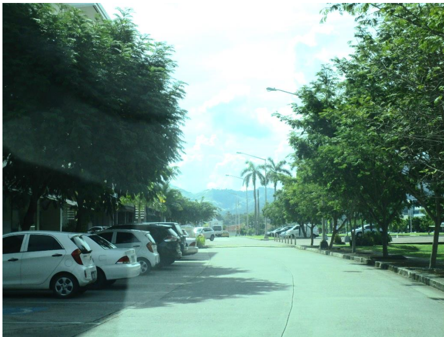
Fotografía 7. Árboles a los costados de una de las vías