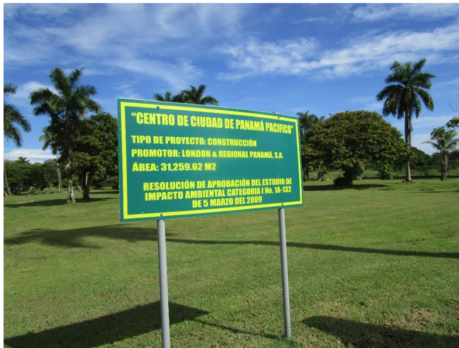
Fotografía 8. Letrero EsIA