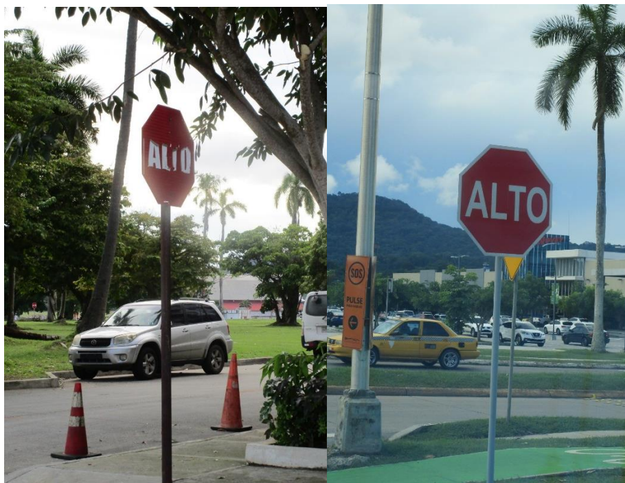
Fotografía 4. Señalizaciones viales