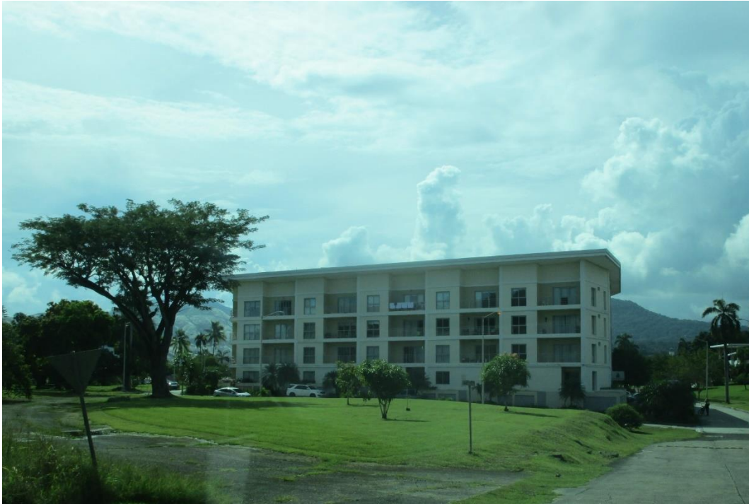
Vista posterior del edificio Soleo