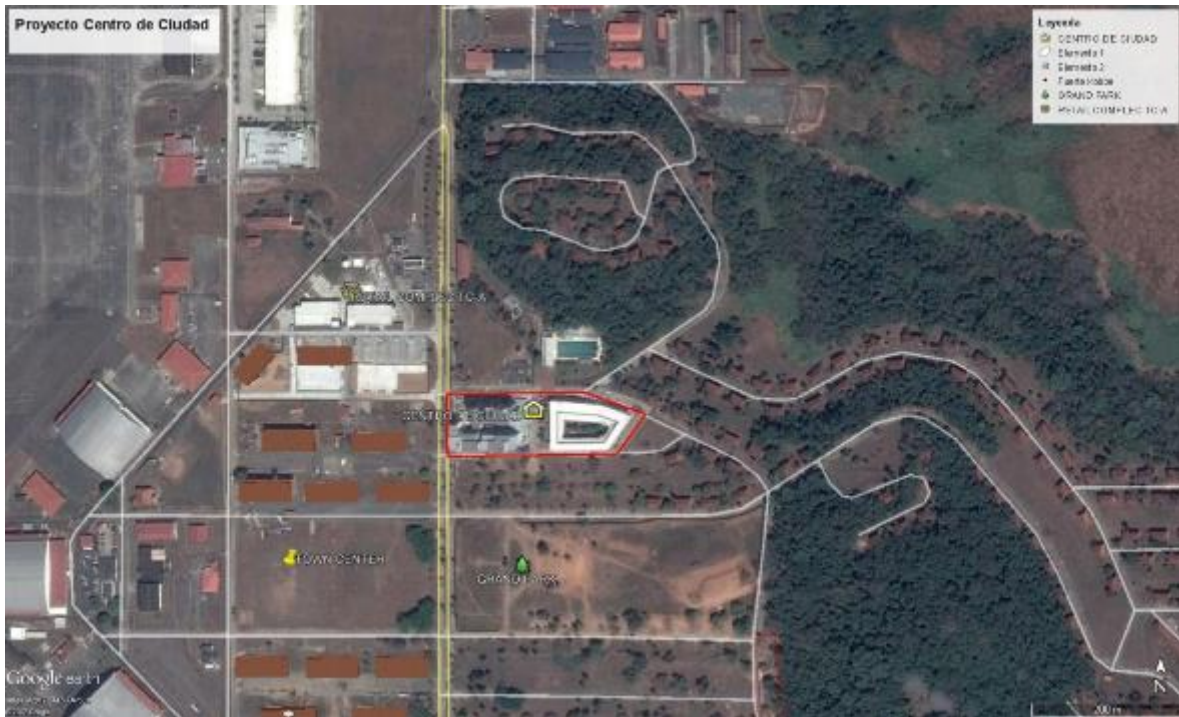
Ubicación regional del proyecto