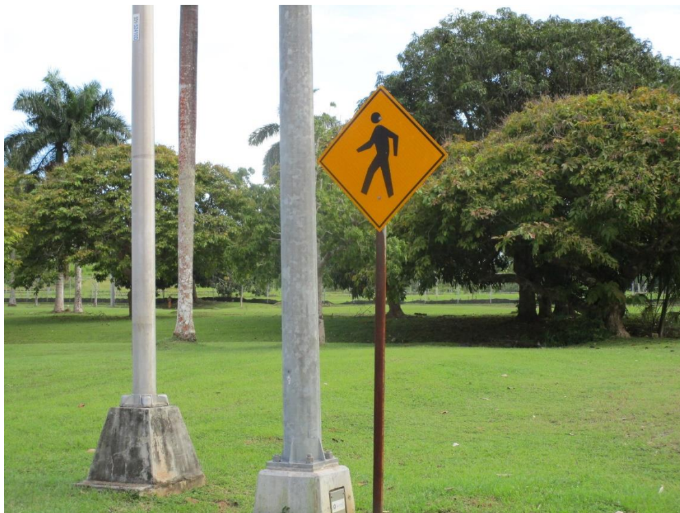
Fotografía 3. Señalizaciones viales