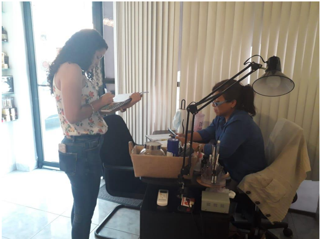
La realización de la encuesta de personas cercanas al proyecto de Unique Suites.