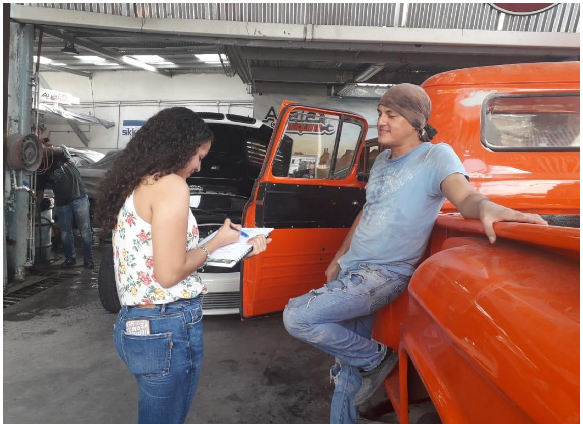
La realización de la encuesta de personas cercanas al proyecto de Unique Suites.