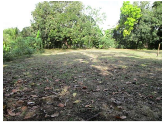
Foto N° 8: Vista general. Tramo prospectado. Alterado por relleno.

El siguiente cuadro muestra las coordenadas tomadas durante la prospección arqueológica: