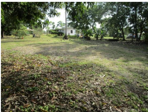
Foto N° 3: Vista general. Terreno plano anegado. Alterado por cultivos de arroz.