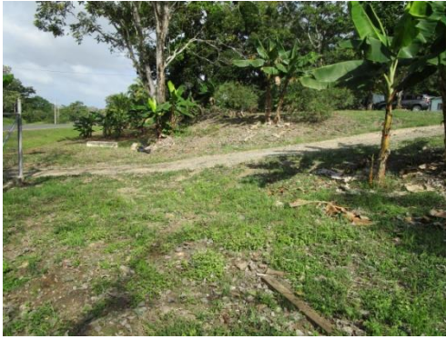
Foto N° 5: Vista general. Tramo prospectado. Alterado por relleno.