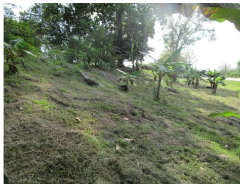
Foto N° 4: Vista general. Terreno plano anegado. Alterado por cultivos de arroz.