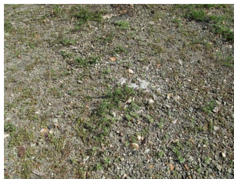
Foto N° 2: Vista general. Terreno plano, alterado por cultivo de arroz.