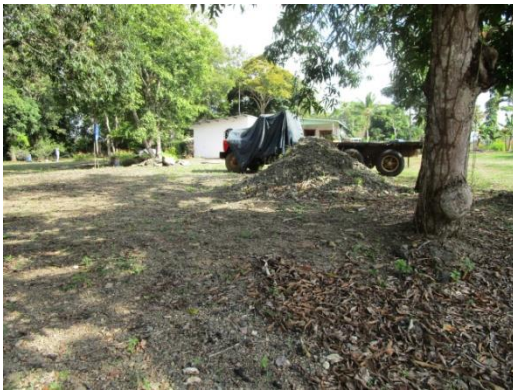
Foto N° 7: Vista general. Tramo prospectado. Alterado por relleno.