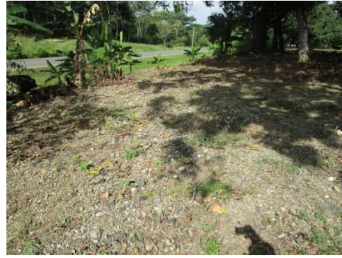
Foto N° 6: Vista general. Tramo prospectado. Alterado por relleno.