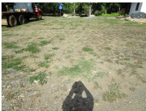
Foto N° 1: Vista general. Terreno plano. Alterado por cultivo de arroz.

El terreno donde se desarrolló esta prospección ocupa un área de 2,366.64 m 2 . Durante el recorrido se pudo constatar que es un terreno sumamente alterado debido a un relleno que se le hizo previamente con gravilla y tosca pero este material será removido, razón por la cual no hubo hallazgos arqueológicos, a pesar de utilizar algunas áreas para la realización de pozos de sondeos en lugares adecuados y propicios.