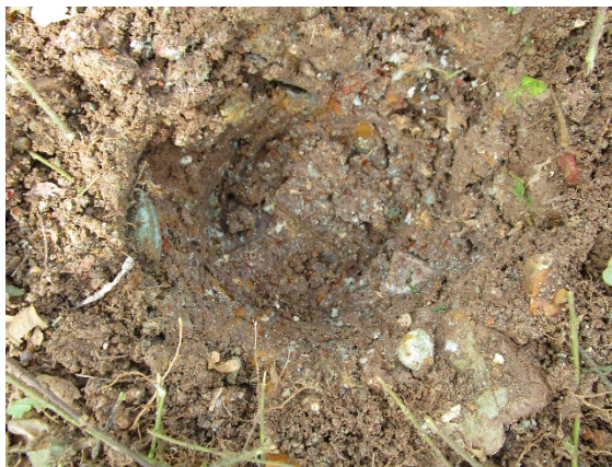
Fotos N°9, N°10, Sondeos efectuados ( Observe nivel toscoso desde los primeros 5 cms),