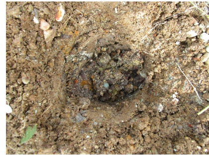
Fotos N°15, N°16 No hubo hallazgos culturales en ninguno de los sondeos, ni en nivel superficial.