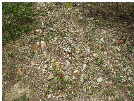
Fotos N°11, N°12, N°13, N°14 Como se observa en las fotos el terreno es predominantemente alterado, los niveles de cascajo por debajo de los primeros 8cm-14cms, en la mayoría de casos.