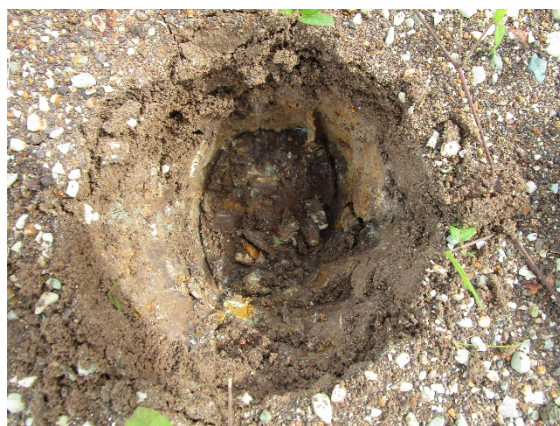
Fotos N°6, N°7, Sondeos efectuados ( Observe nivel tocoso desde los primeros 5 cms),