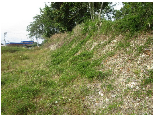
Foto N°3 Corte de maquinaria ( de hace varios años) en polígono , visible alteración.