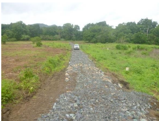
Foto N°1: Vista general. Entrada al Proyecto. Alterado por construcción de camino.

En su mayoría los hallazgos fueron a nivel superficial las cuales fueron movidas por el arrastre por las altas precipitaciones en la zona. Se hicieron prospecciones a lo largo de todo el polígono encontrándose hallazgos dentro de él.