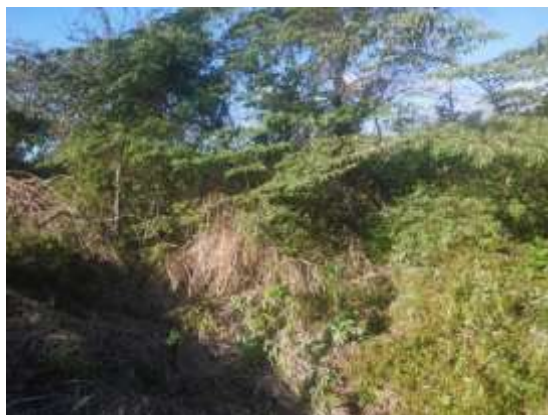
Foto N° 6: Vista general. Tramo prospectado. Terreno plano de tipo potrero