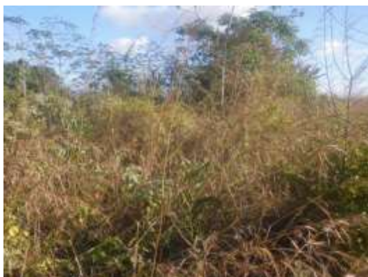
Foto N° 7: Vista general. Tramo prospectado. Terreno plano de tipo potrero, densa vegetación.