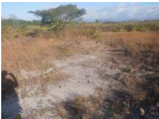
Foto N° 5: Vista general. Tramo prospectado. Alfloramiento rocoso.