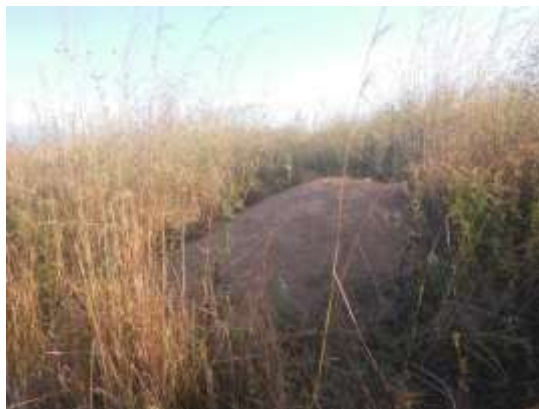
Foto N° 4: Vista general. Tramo prospectado. Alterado por relleno.