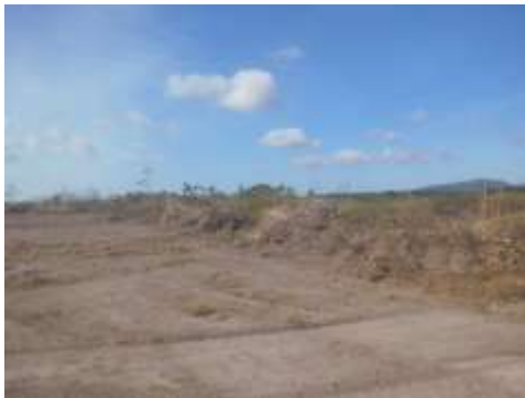
Foto N° 11: Vista general. Tramo prospectado, alterado por corte.