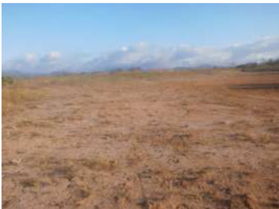
Foto N° 3: Vista general. Tramo prospectado. Terreno plano de tipo potrero.