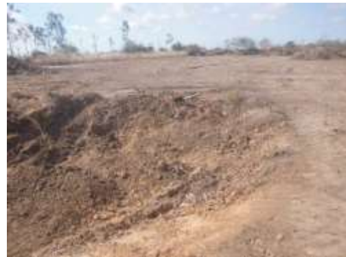
Foto N° 12: Vista general. Tramo prospectado. Alterado por corte.