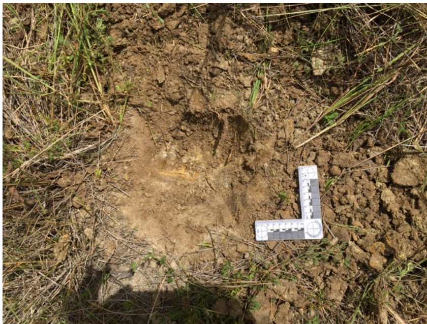
Fotografía 7.- Detalle de sondeo