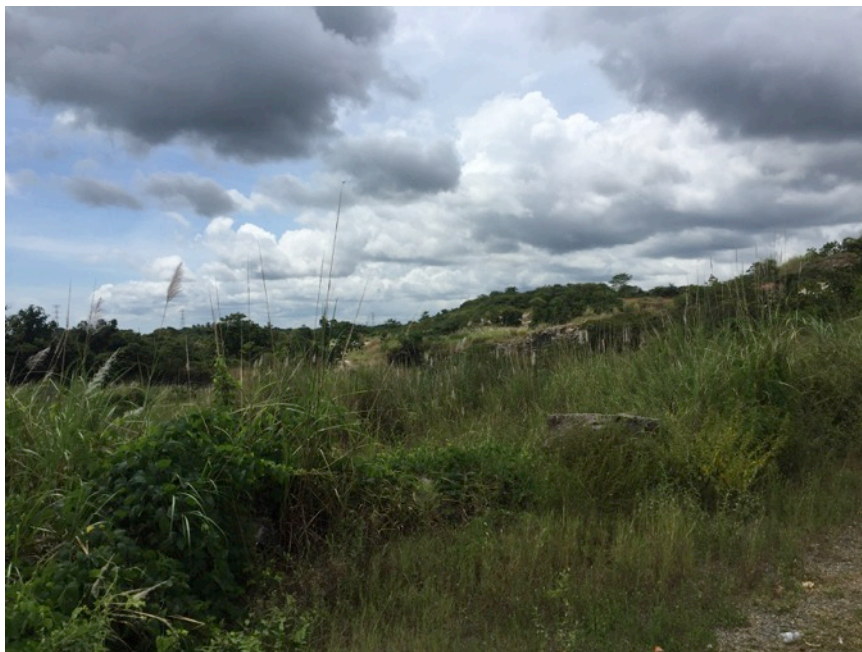
Fotografía 4.- Vista general del área