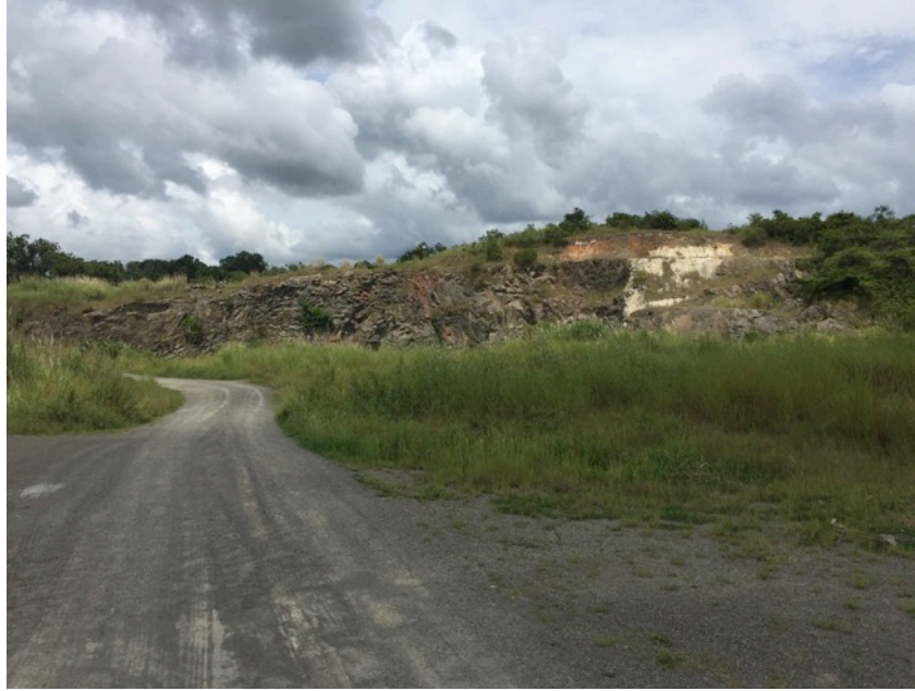
Fotografía 1.- Vista general del área