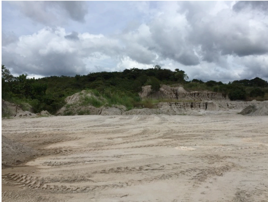
Fotografía 3.- Vista general del área