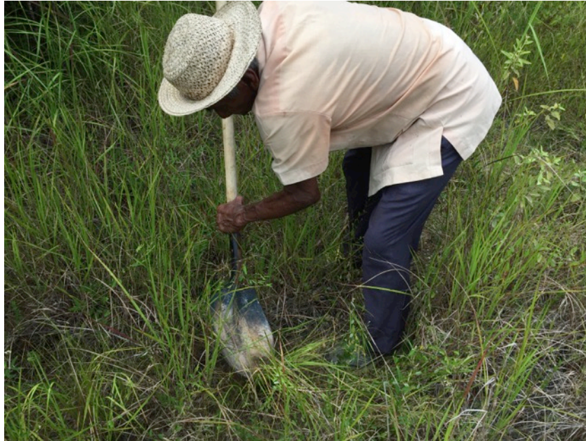
Fotografía 5.- Proceso de evaluación