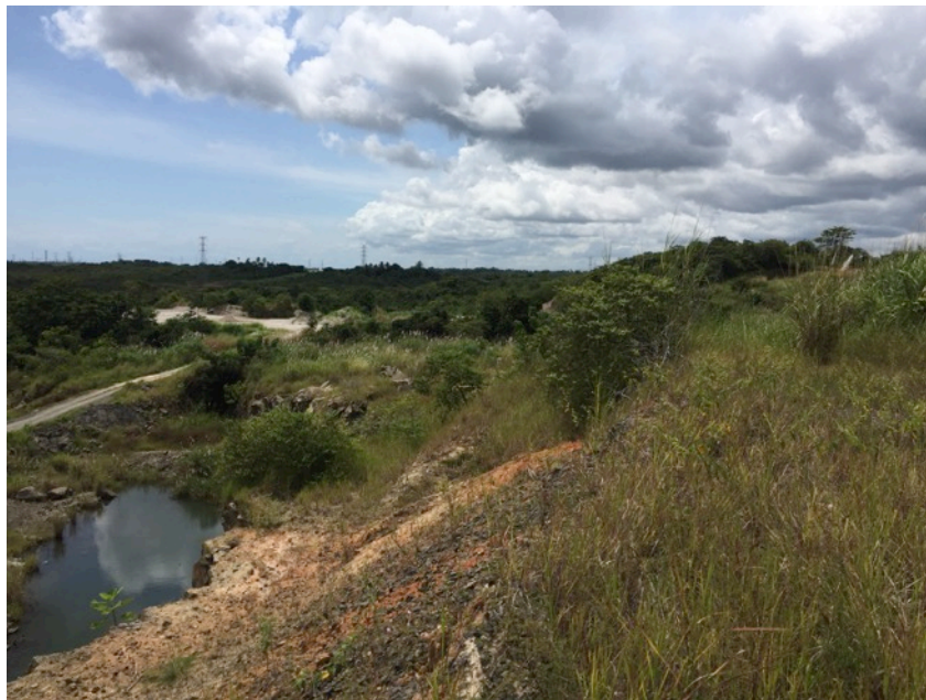
Fotografía 2.- Vista general del área