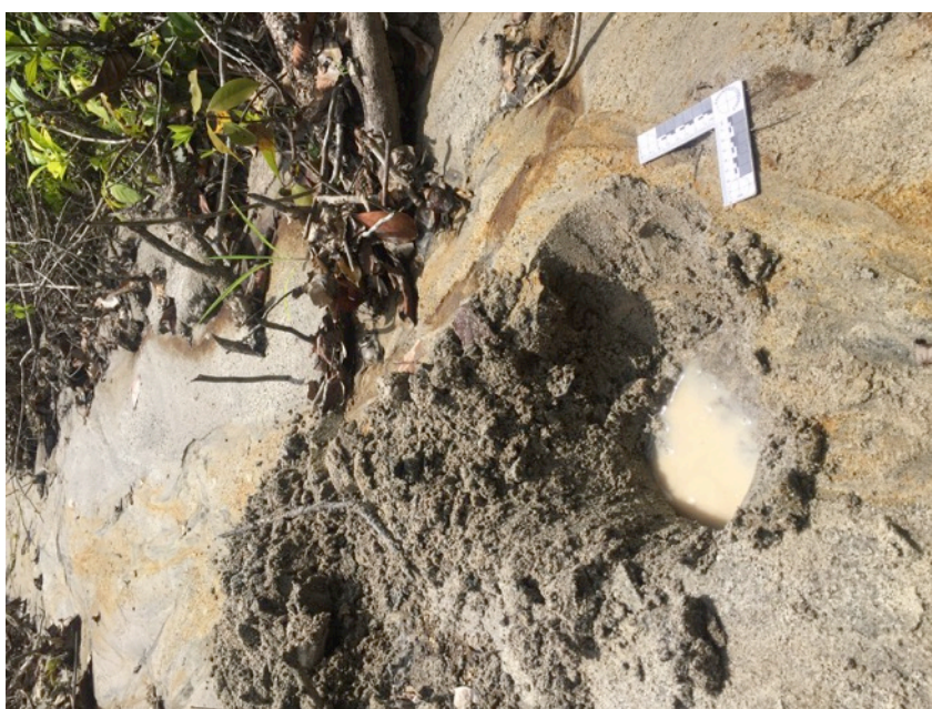
Fotografía 8.- Detalle de sondeo

Coordenadas de los puntos de verificación. Datum consignado