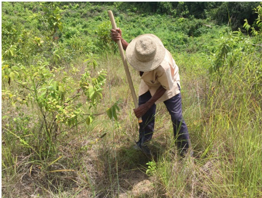
Fotografía 6.- Proceso de evaluación