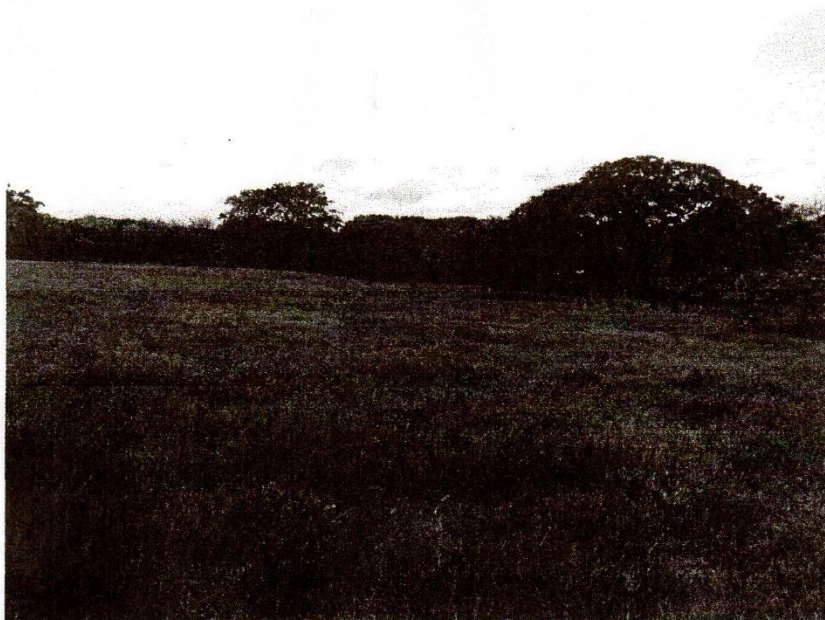
Vista de un alto porcentaje de la finca evaluada donde presenta leves pendientes, hacia el drenaje natural