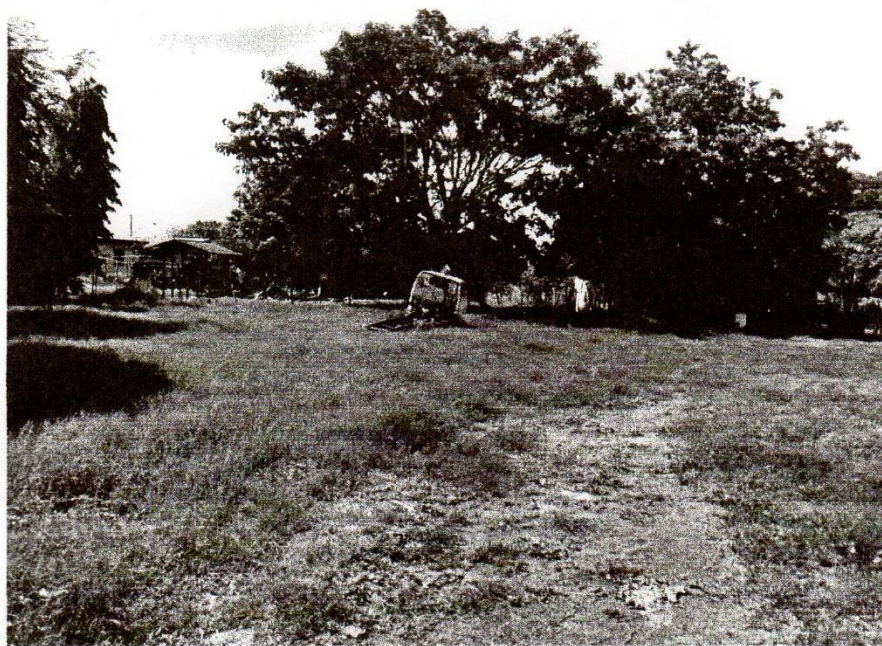
Parte más alta de de la finca colindante con viviendas unifamiliares