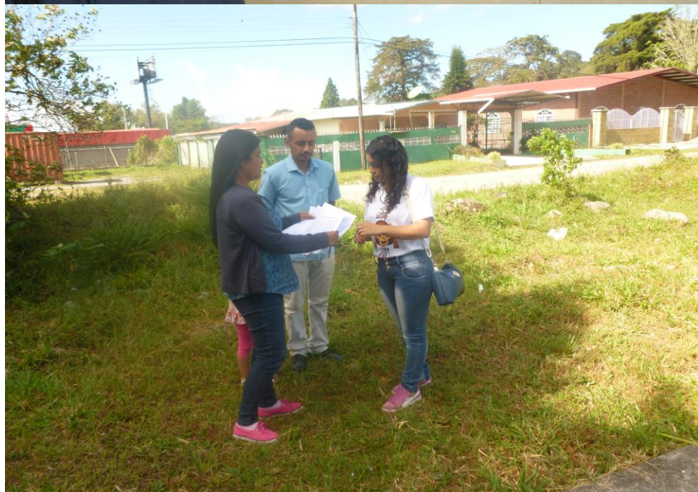
Participación ciudadana realizada a la comunidad