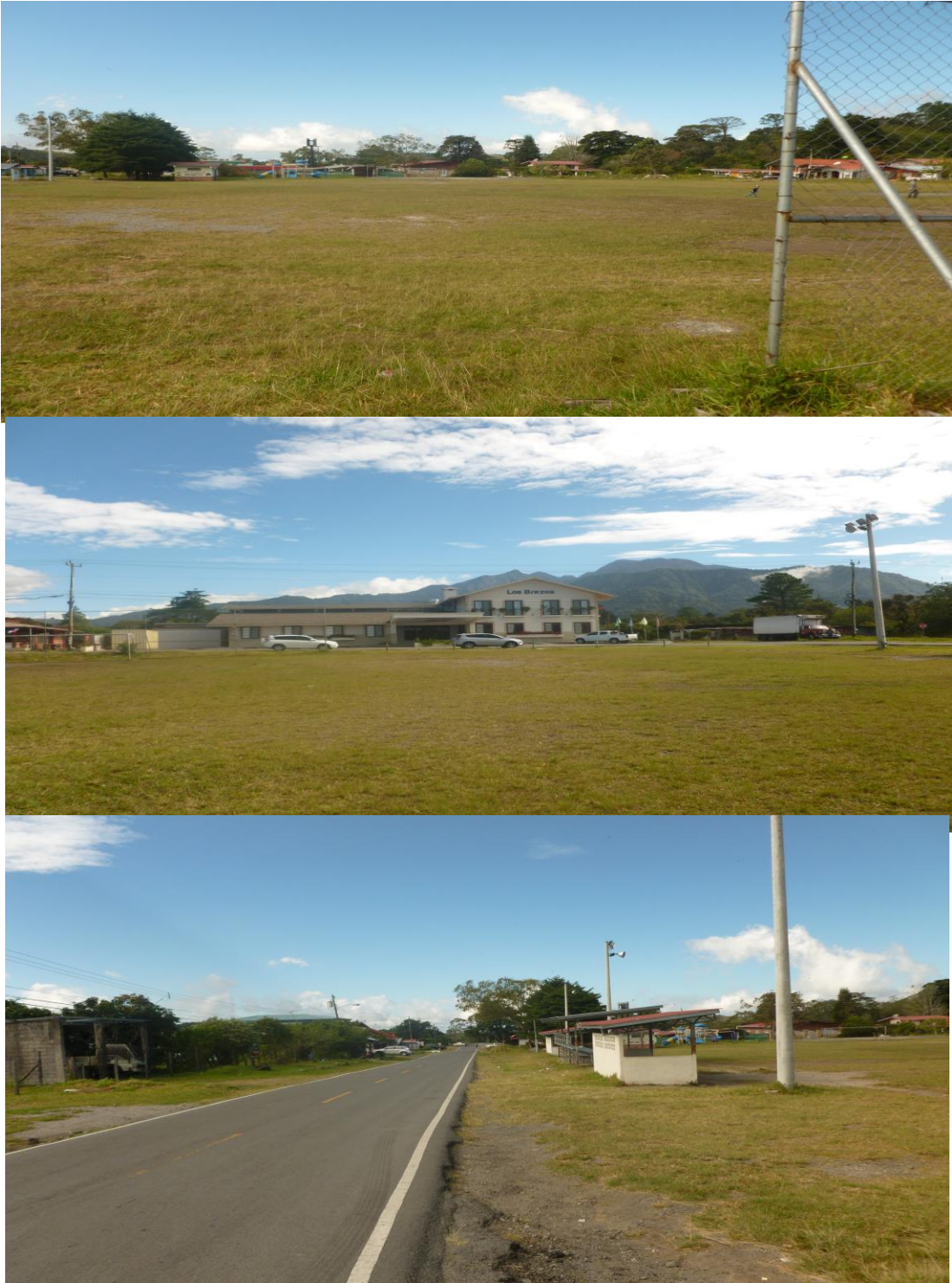
Vista general del terreno donde se desarrollará el proyecto