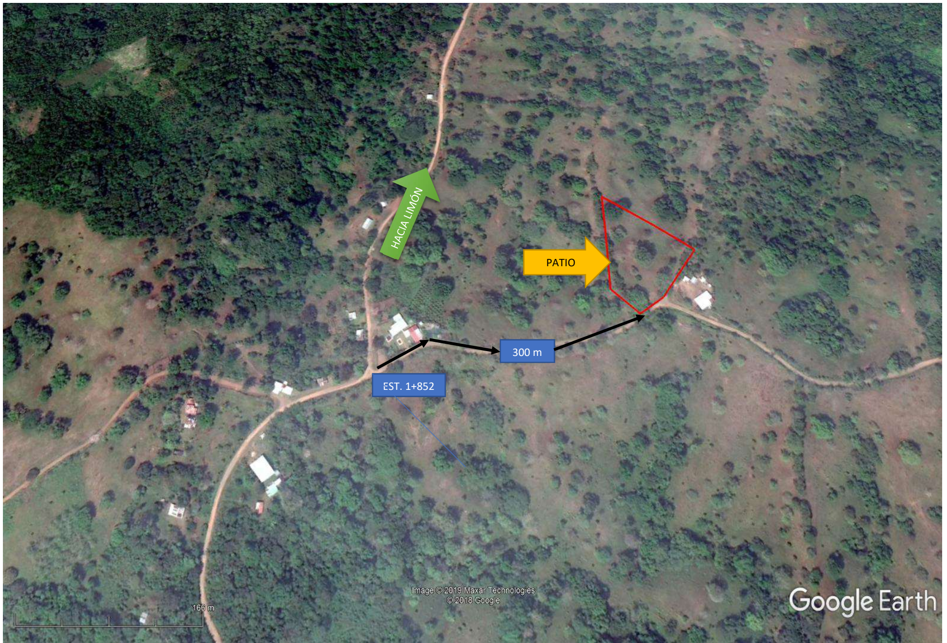
PATIO DE MÁQUINAS Y OFICINA