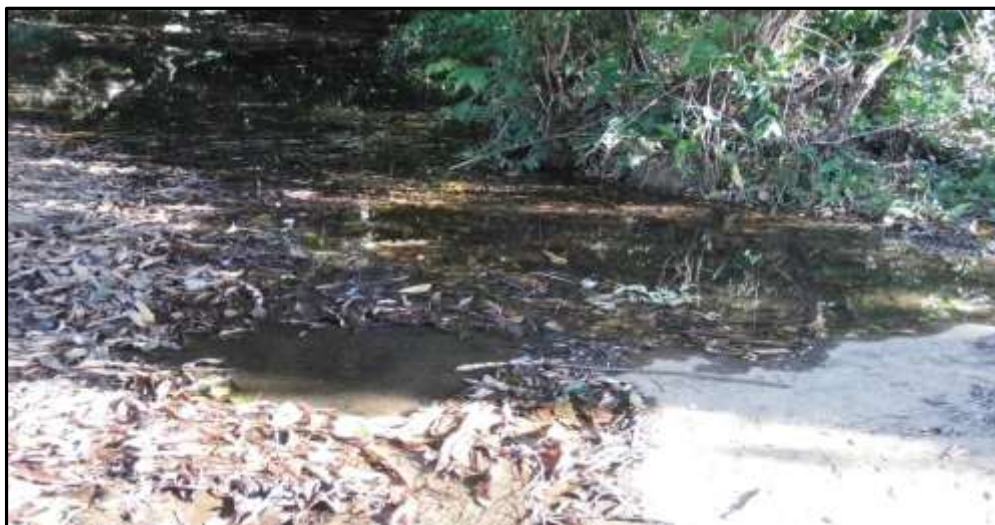
Fotografías N° 3. Vistas cuerpo de agua (quebrada) en área de influencia indirecta al proyecto (la escuela).

No existen fuentes hídricas superficiales en el sitio del área de influencia directa. No obstante, se observó un cuerpo hídrico (quebrada) en área de influencia indirecta, aproximadamente a 700 metros de la escuela de poco caudal y con un bosque de galería, formado por especies, tales como: espavé, guarumo, balso, higo, entre otros. Los residentes cercanos a la escuela manifestaron tomar agua de la quebrada, para baño y usos domésticos.