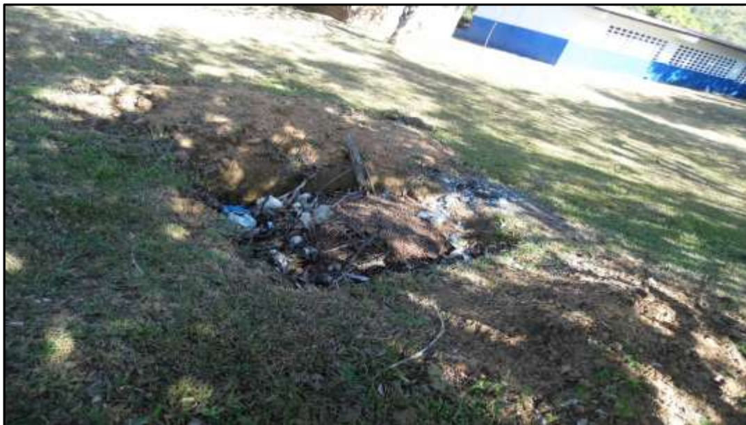
Fotografía N° 2. Vista que dice la forma en que en la escuela El Gavilán, se manejan los desechos sólidos.

En fase operativa, los orgánicos no degradables e inorgánicos (papeles, plásticos, restos de madera, etc.), serán gestionados por las Autoridad Educativas. Para ello se les recomendará, técnicas de clasificación, reutilización. Quedando como opción final, la disposición (enterramiento tal y como se muestra en fotografía N° 29.