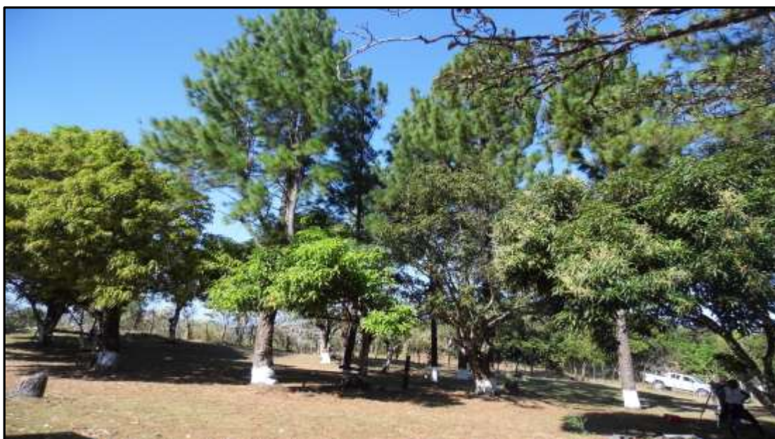
Fotografías N°4. Vistas de la vegetación dentro del área de influencia directa del proyecto.