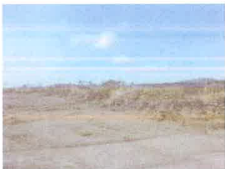
Foto N° 11: Vista general. Tramo prospectado, alterado por corte.