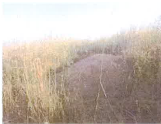
Foto N° 4: Vista general. Tramo prospectado. Alterado por relleno.