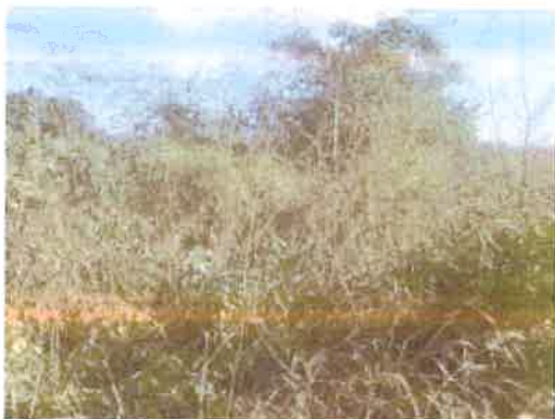
Foto N° 7: Vista general. Tramo prospectado. Terreno plano de tipo potrero, densa vegetación.