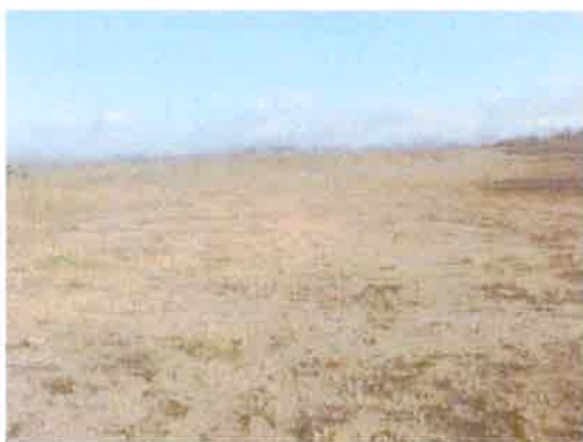
Foto N° 3: Vista general. Tramo prospectado. Terreno plano de tipo potrero.