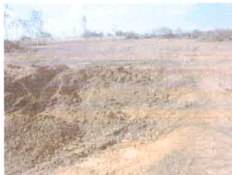
Foto N° 12: Vista general. Tramo prospectado. Alterado por corte.