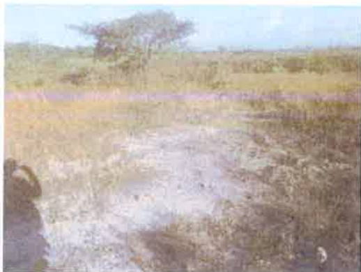
Foto N° 5: Vista general. Tramo prospectado. Alfloramiento rocoso.