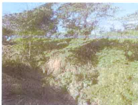
Foto N° 6: Vista general. Tramo prospectado. Terreno plano de tipo potrero