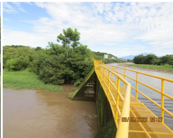
Imágenes 6.1 a 6.6. Vistas de las condiciones del área de trabajo