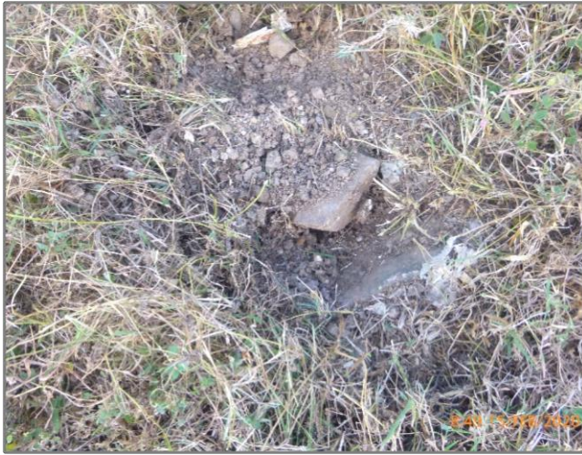
Foto 4. Vista del Sondeo 1.

localiza en las siguientes coordenadas UTM del sistema WGS84: E667924.289, N1002287.407 y la altitud de 55.00msnm.