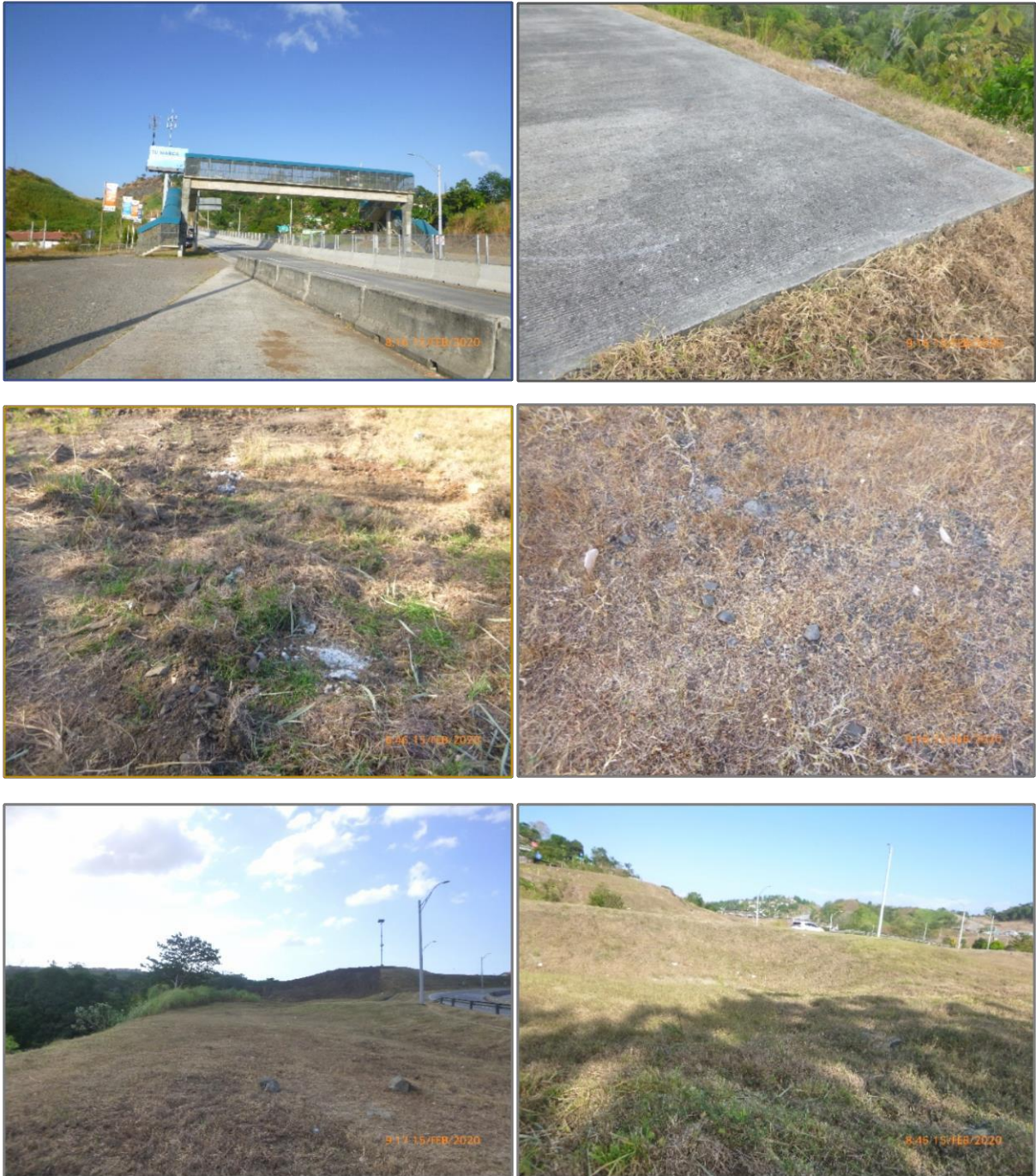
Fotos 6 – 17. Vistas del área de proyecto en diferentes ángulos, carretera asfaltada, suelos cortados, removidos y en los hombros de la vía con rellenos de gravas y piedras.