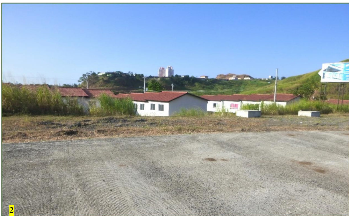
Foto 2. Vista panorámica (desde la Avenida Rafael E. Alemán) una parte del área de proyecto, las construcciones modernas y la vía de acceso a las barriadas.

El ambiente biológico del área bajo estudio ha sufrido de una gran intervención antrópica debido principalmente se ha dado por varios años al uso del terreno para diferentes actividades antrópicas que ha perturbado, eliminado y desplazado la vegetación original del área. La vegetación original ha sido convertida en su mayoría en herbazales y rastrojos. Y por último, se ha cambiado totalmente el paisaje original del área de proyecto, por las construcciones modernas y por obras de infraestructuras como las vías de accesos a las barriadas y la construcción de Corredor Norte.