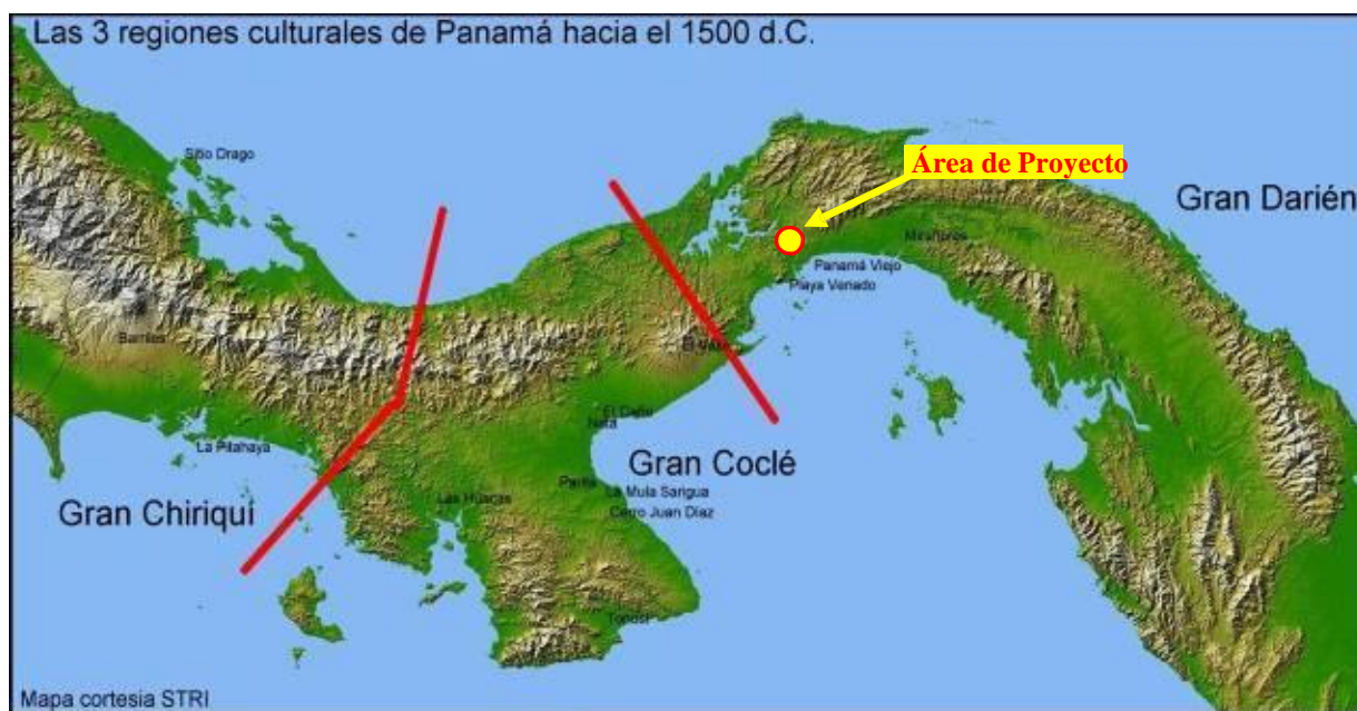
Figura 2. Ubicación de sitios arqueológicos y división de las regiones culturales de Panamá durante la Época Prehispánica.

existieron importantes centros de manufactura de mayólicas, y uno de ellos en Malambo ubicado en la periferia de Panamá Viejo (Cruxcent 1979:22).