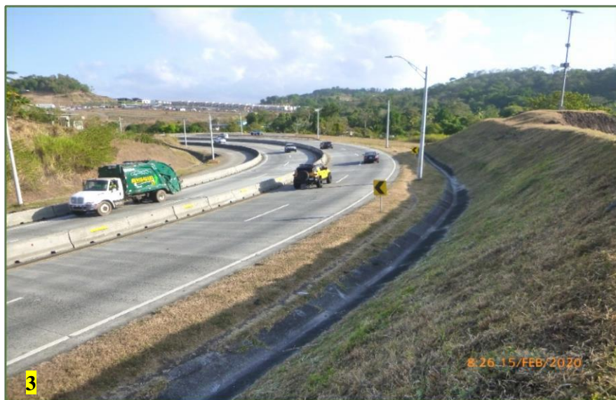
Foto 3. Vista panorámica del área de proyecto en la Avenida Rafael E. Alemán, a la izquierda tramo en proyección.

Se ha recorrido por todo el tramo del proyecto, en el transcurso de inspección del área no se observó ningún artefacto arqueológico que relacione a las actividades humanas prehispánicas e hispánicas.