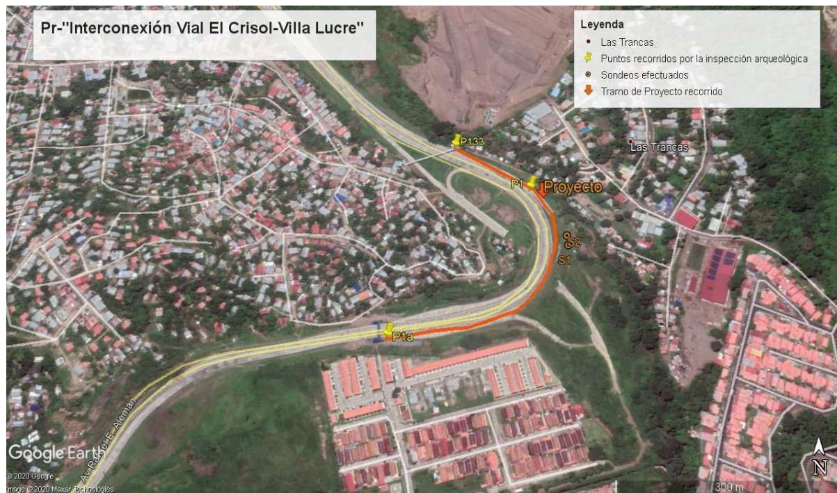
Figura 3. Imagen aérea: cortesía de Google earth.

recorrido del tramo de proyecto, en el transcurso de la inspección arqueológica, no se detectó ningún material cultural que relacione a las actividades humanas prehispánicas e hispánicas.