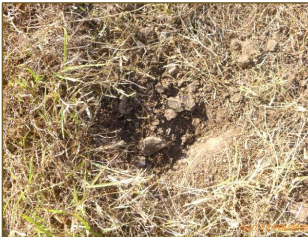
Foto 5. Vista del Sondeo 2.

Sondeo 2: Este sondeo se ubicó en las siguientes coordenadas WGS84: E667923.696, N1002303.048 y la altitud de 36msnm. Se preparó una cuadrícula de 25 x 25cm., con una profundidad de un solo nivel de 10cm. Del 0 - 10cm suelo capa superior color entre pardo y crema, relleno de gravas. Cubierta de pocas hierbas y secas.