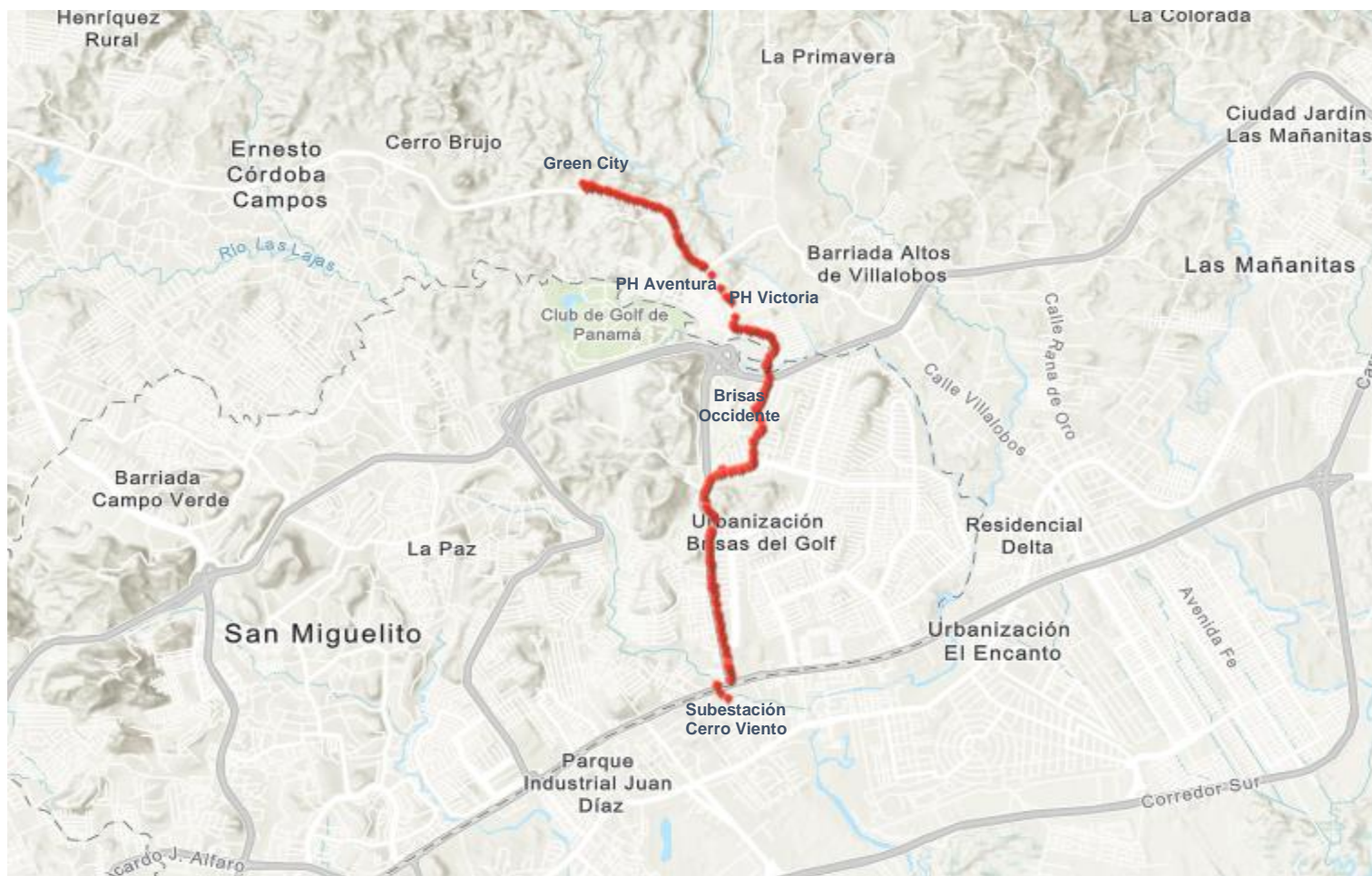
Figura 1.1. Ubicación geográfica del proyecto “Extensión de Línea Trifásica – Panamá Norte”