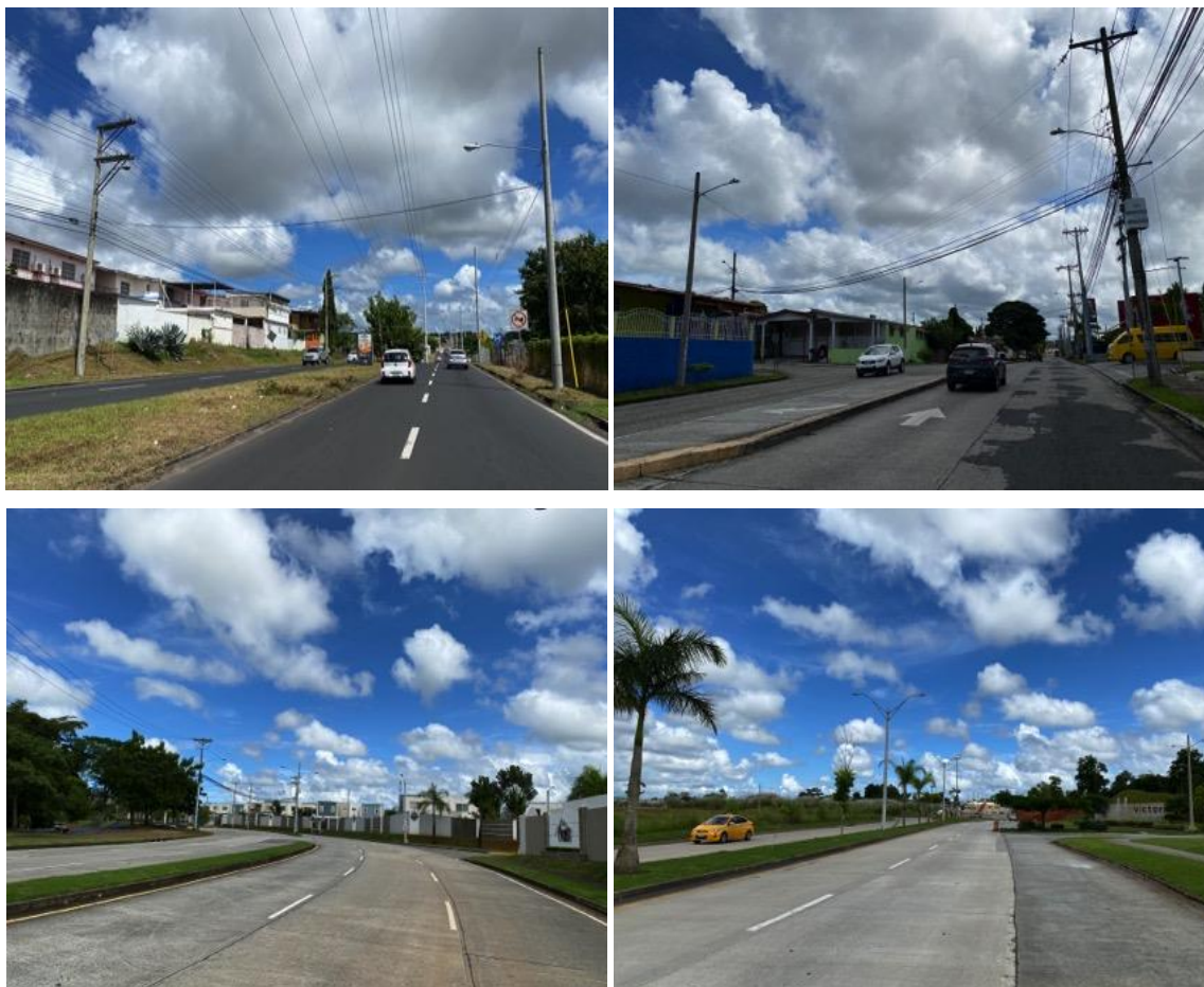
Imágenes 1.1, 1.2, 1.3 y 1.4. Vistas generales del área